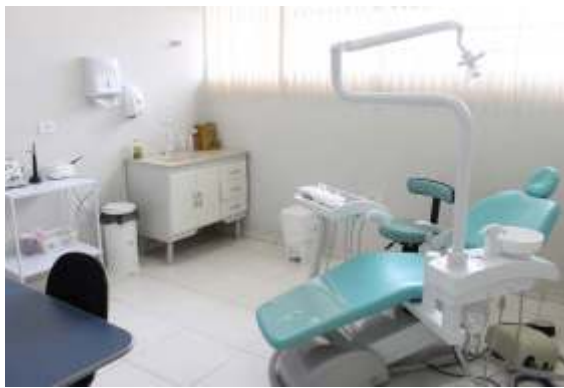
Moradores do Cruzeiro recebem nova sala odontológica na unidade de saúde