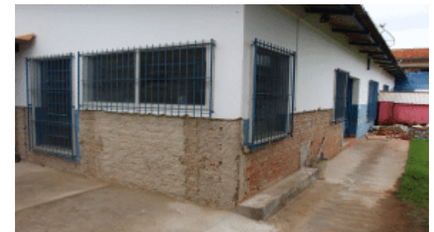
Prefeitura investe mais de R$ 1 milhão em reforma de Escolas Municipais. As obras estão sendo realizadas com recursos próprios da Secretaria Municipal de Educação