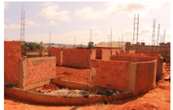
Prefeitura inicia construção da nova sede do CRAS no Jardim São Paulo