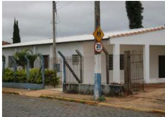
Prefeitura revitaliza Posto de Saúde do Bairro Velho