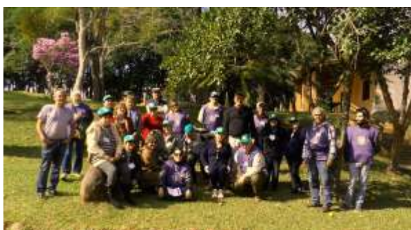
Prefeitura em parceria com o sindicato Rural promove curso de Monitor Ambiental