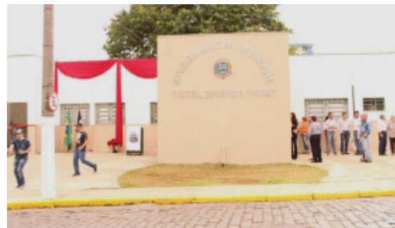
Nova sede da Secretaria Municipal de Educação é inaugurada garantindo economia aos cofres públicos, visto que o prédio é próprio.