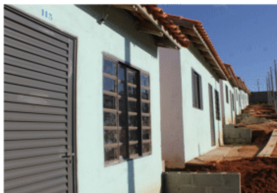
Prefeitura entrega 36 casas do Minha Casa Minha Vida no Jardim São Paulo