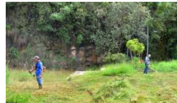
Limpeza e manutenção do Parque Ecológicoda Barreira