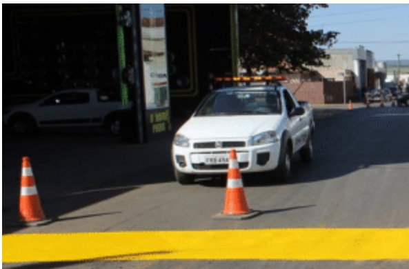
Aquisição de veículo para aprimoramento dos serviços de sinalização e fiscalização do trânsito.