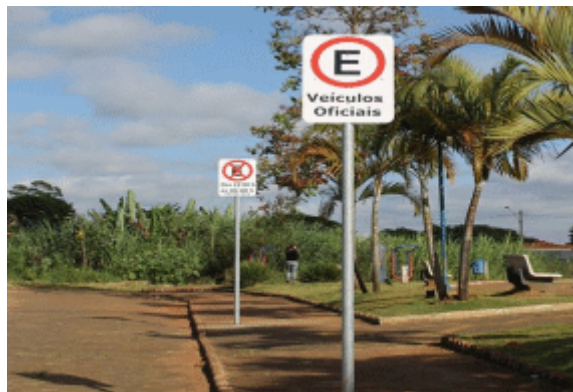
Prefeitura de Itararé instala novas placas de sinalização em vários pontos do município