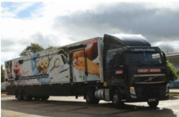
Parceria entre Prefeitura e Senai promoveu curso gratuito de modelista