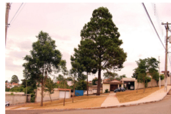
Prefeitura revitaliza Praça do Pinheiro no Bairro do Ginásio