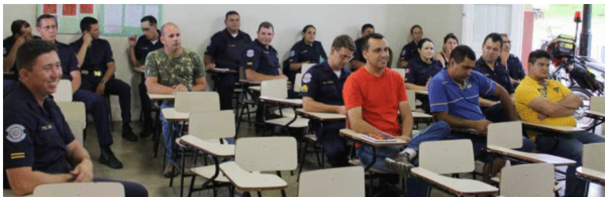
Prefeitura forma agentes de trânsito