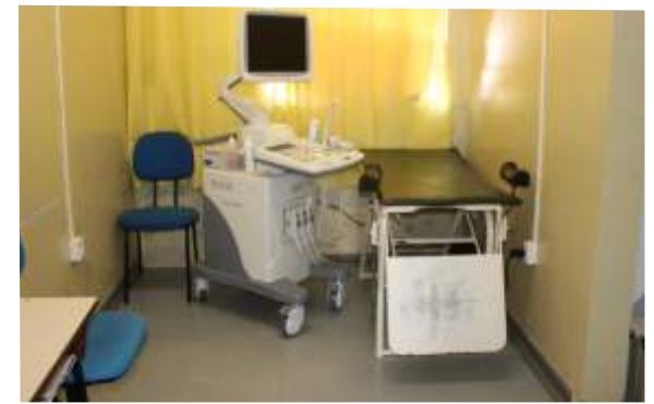
Prefeitura adquire aparelho de ultrassom de última geração para a Santa Casa