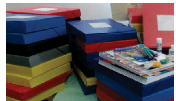
Alunos recebem Kit Escolar. Foram entregues 600 kits, que continham itens como cadernos, canetas, lapis, régua, cola, apontador e etc.