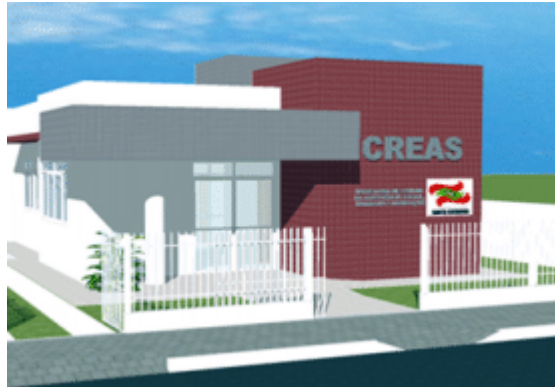
Prefeitura inicia construção da nova sede do Creas no Bairro do Ginásio