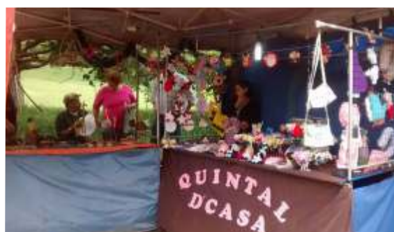
Incentivos aos artesãos municipais e apoio à promoção de feiras de artesanato