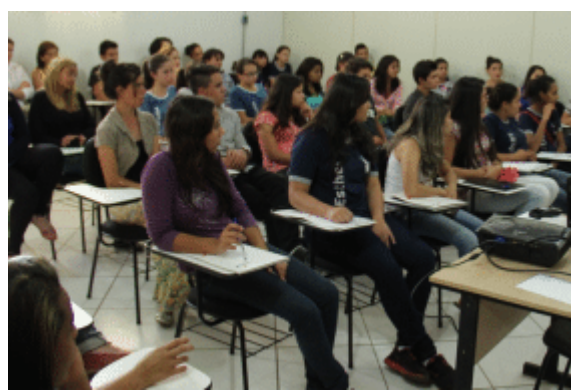
210 alunos participaram de cursos gratuitos realizados pelo SENAC