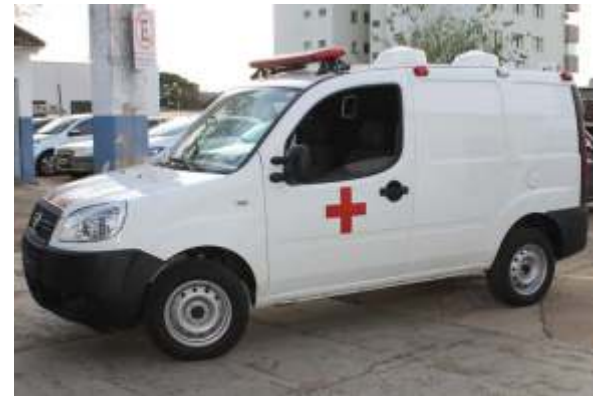
Prefeitura adquire nova ambulância para Saúde