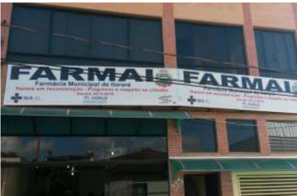
Prefeitura inaugura novas instalações da Farmai. São 6 mil atendimentos por mês.