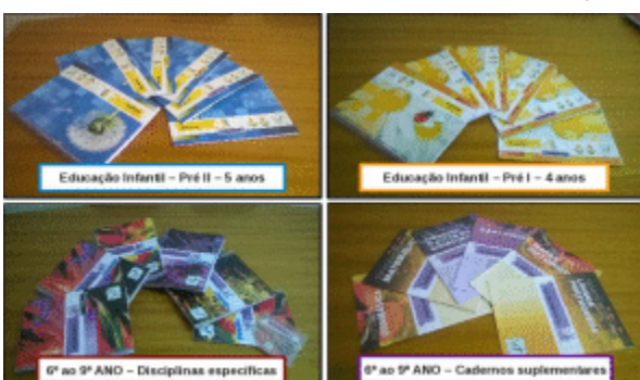
Objetivando a melhoria na qualidade de ensino a prefeitura entrega material apostilado para os alunos da rede municipal