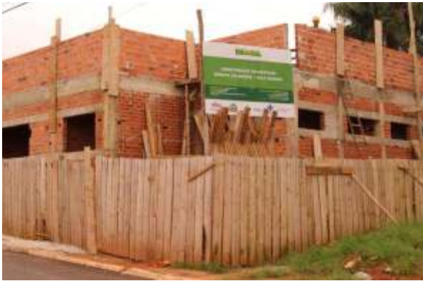
Prefeitura inicia construção do novo Posto de Saúde na Vila Osório