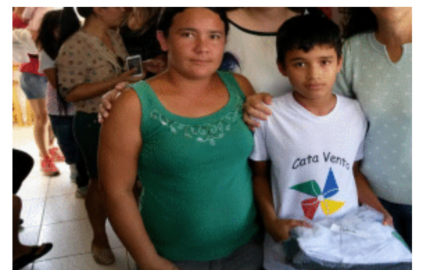
Prefeitura entrega uniformes para alunos do Projeto Cata-Vento