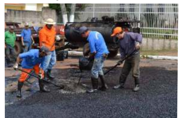
Prefeitura intensifica operação tapa-buracos nos bairros da cidade