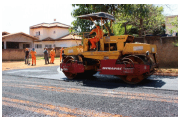
Prefeitura inicia programa de pavimentação no Jardim São Paulo, Jardim Regiane, Jardim São Pedro Horigome e Parque Centenário