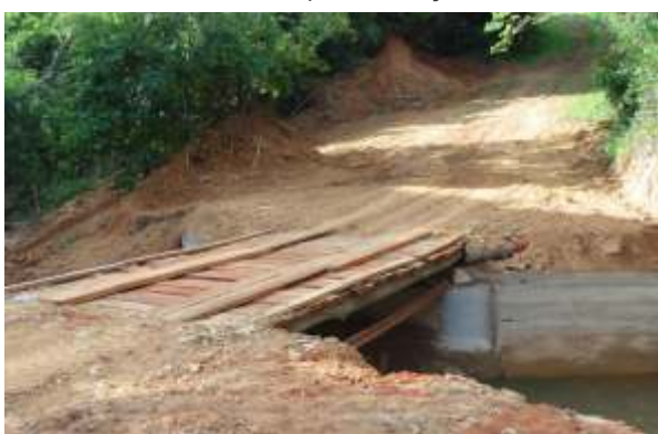
Secretaria de Serviços Municipais construiu e revitalizou diversas pontes de madeira na Zona rural