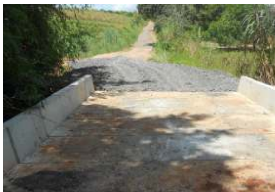
Secretaria de Serviços Municipais constrói ponte na zona rural