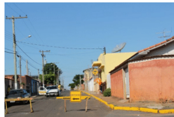
Prefeitura instala lombadas com o objetivo de contralar as altas velocidades