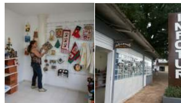
Abertura da loja de artesanato contribuindo com a geração de renda dos artesãos locais. Reativação do posto de informações turísticas (INFOTUR)