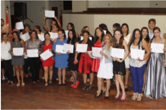
Em parceria com o SENAI e SENAC a prefeitura promove cursos profissionalizantes