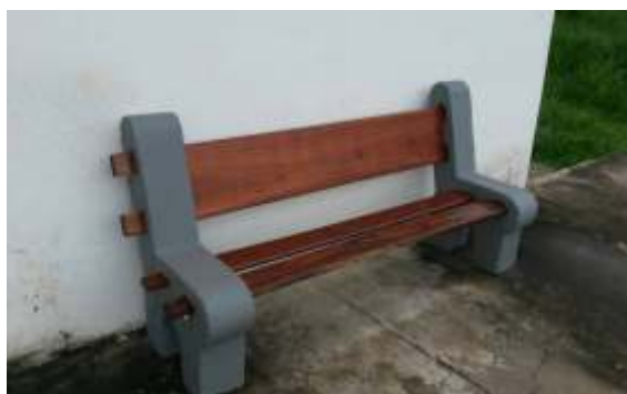
Revitalização dos bancos da Praça Francisco Alves Negrão