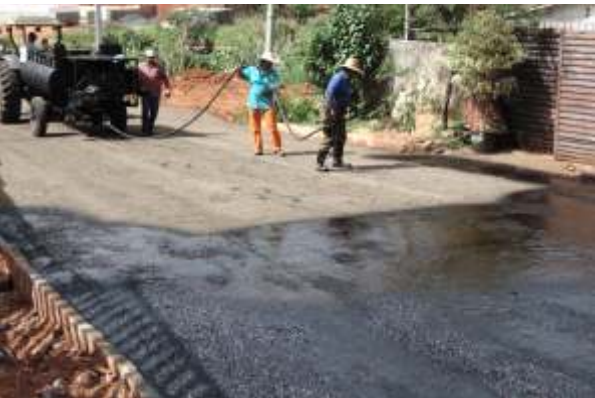
Prefeitura investe com recursos próprios e leva asfalto a vários bairros. Foram ao todo 6 mil metros quadrados de pavimentação. Os bairros contemplados foram Vila Osório, Jardim Alvorada, Jardim Paulicéia e Jardim Regina