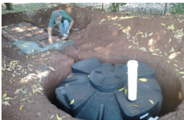
Prefeitura instala 55 Fossas Sépticas na zona rural. Moradores aguardavam há anos benfeitoria