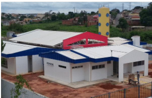
Prefeitura finaliza construção de nova creche no Jardim Alvorada que atenderá cerca de 100 crianças