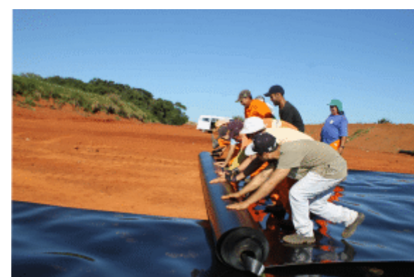
Prefeitura investe R$ 1,5 milhão no Aterro Sanitário e recebe licença de operação definitiva