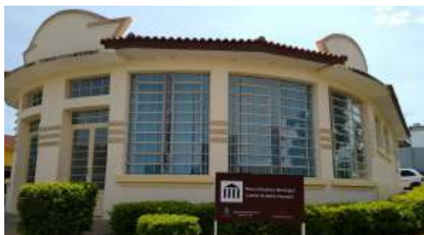
Inauguração do Museu Histórico Municipal Camillo de Mello Pimentel