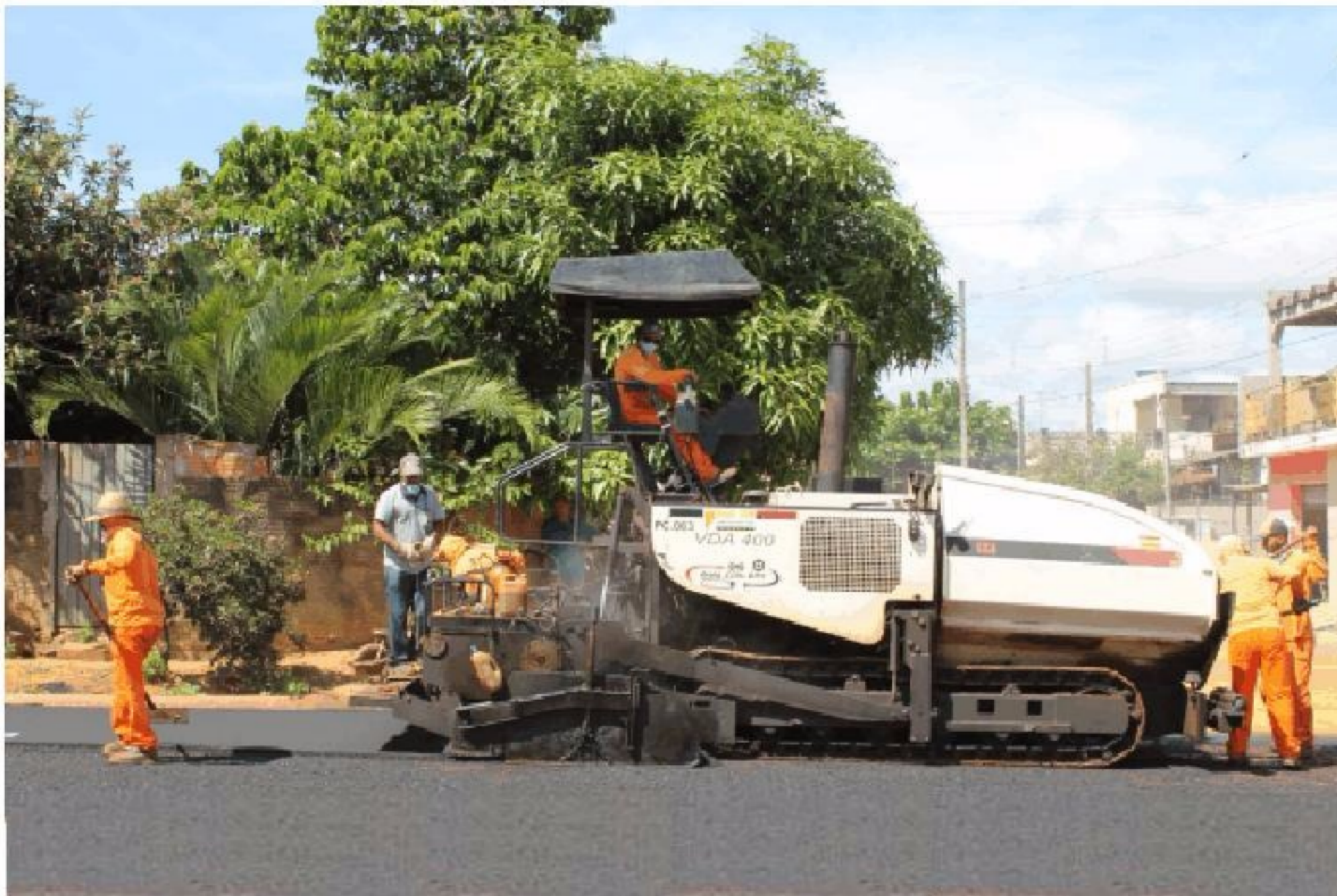
O valor de investimento nesta etapa foi de R$ 197.100,00, sendo R$ 19.644,90 de contrapartida da administração municipal. Pág.3