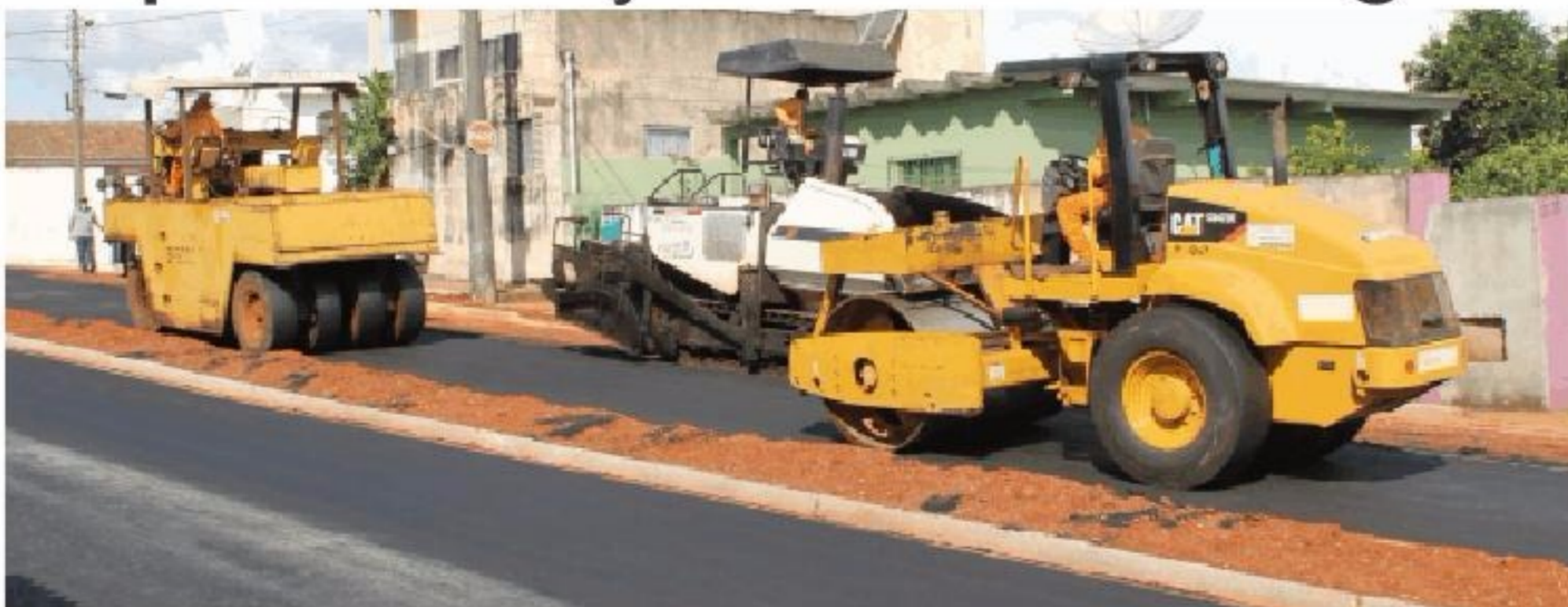
Os recursos para a realização da pavimentação são provenientes de uma emenda parlamentar, que através do Ministério das Cidades divide a liberação do dinheiro em 50, 30 e 20%. Pág.3