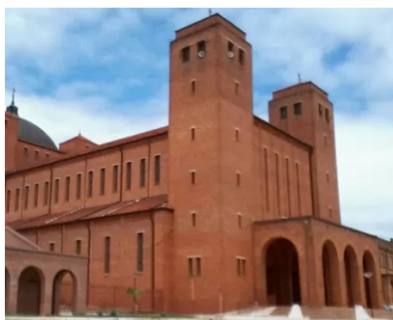
Abadia de N.S. da Santa Cruz em Itaporanga