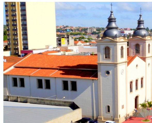
Catedral de Sant'Ana em Itapeva