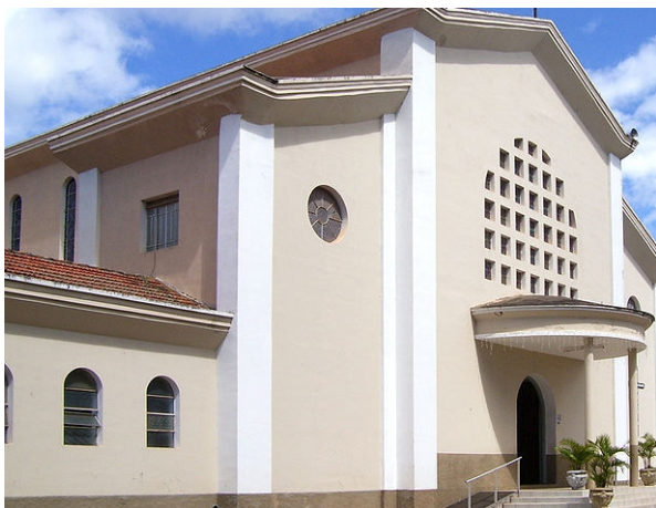
Igreja Matriz em Itararé

De acordo com a Coordenadoria de Turismo de Itararé, que atua efetivamente no desenvolvimento do turismo regional, o momento do turismo é agora, temos acompanhado as diretrizes estaduais em favor dessa atividade e esperamos que esses benefícios alcancem nossa região e estamos trabalhando para isso, planejando, criando parcerias e agindo dentro dos limites de nossos recursos para que a atividade seja reconhecida como um fomentador da economia e um incentivador da preservação ambiental e cultural.