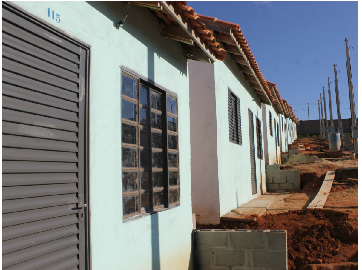
A Prefeitura de Itararé através da Secretaria de Habitação realizou na tarde desta quinta-feira (17), na sede do Crás Novo Horizonte, o sorteio de 36 casas do Programa do governo federal, Minha Casa Minha Vida, que fica no Jardim São Paulo II. Pág. 3

Os interessados que queiram participar do programa, fazer a quitação ou parcelamento de dívidas, devem dirigir-se ao Setor de Receita da Prefeitura Municipal, até o prazo máximo de 30 de novembro de 2015. Pág. 2