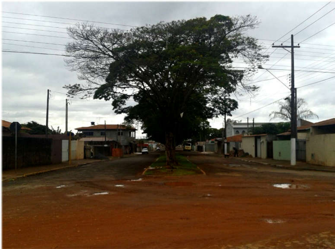
Cruzamento da Rua Roberto Teodorico Côrtes e Av. Gabriel Jorge Merege, ambas receberão melhorias pag. 3