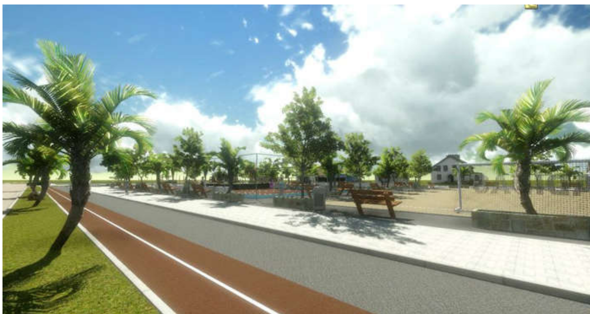
O projeto, que estava parado há 13 anos, é uma extensão da Área de Lazer Miguel Jorge Fadel pag.3