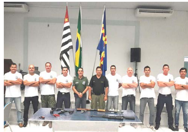
GCMs de Itararé com a equipe da Amarelinha Treinamentos