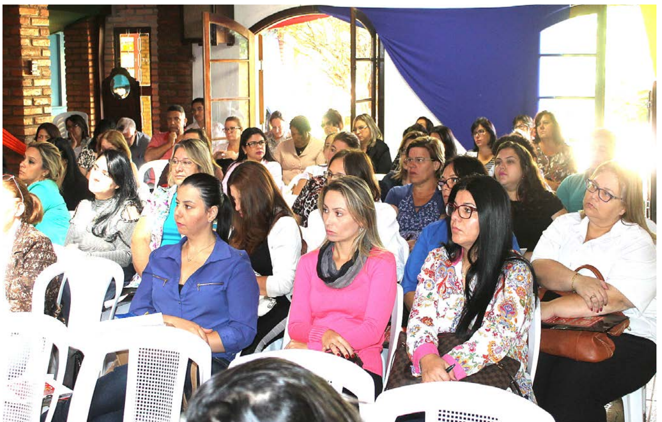
Os participantes se reúnem em busca do fortalecimento de vínculo para implantação de políticas eficazes no combate ao trabalho infantil

Participaram as secretarias e coordenadorias municipais, entidades sociais, Diretoria Estadual de Ensino e representantes da sociedade, todos em busca do fortalecimento da rede para a implantação de políticas públicas eficazes na erradicação do trabalho infantil.