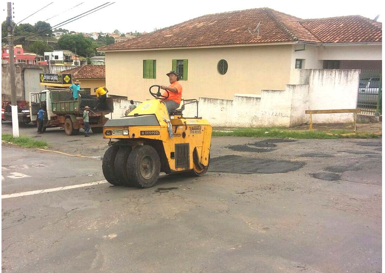
Funcionários trabalham na recuperação da rua Frei Caneca, esquina com Joaquim Dias Tatit.

Solicitações – Os serviços, tanto de tapa buracos quanto de limpeza, podem ser solicitados diretamente na Secretaria, localizada a rua 13 de Maio, nº 13 ou via telefone – 3532 4378.