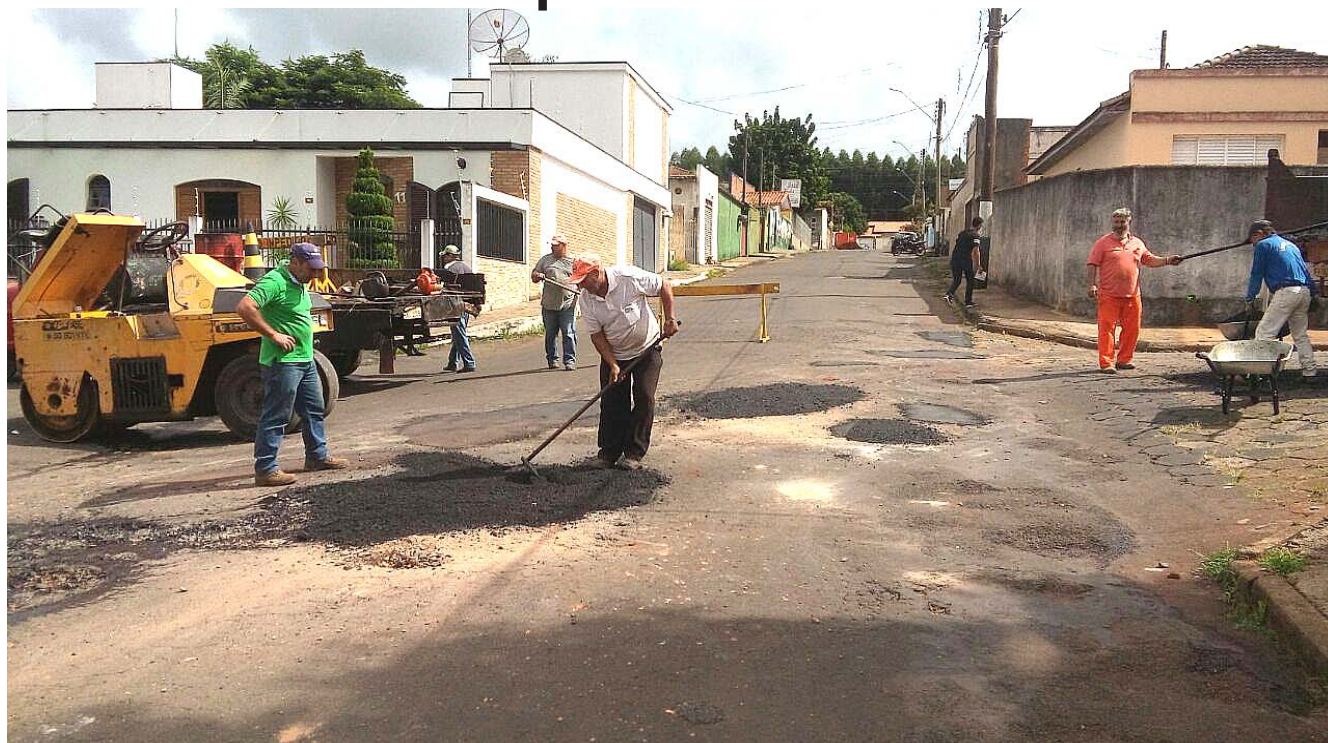
Equipe da Secretaria de Serviços Municipais trabalha na rua Joaquim Pereira, na Vila Osório. Objetivo é reparar 100% das ruas. Pág.3