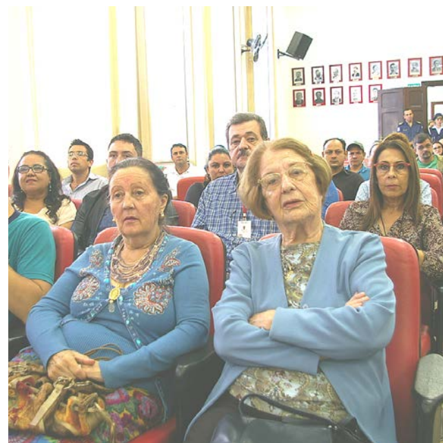
Evento contou com a participação ativa das mulheres de Itararé

Evento teve como objetivo a garantia da política nacional na atenção à saúde feminina