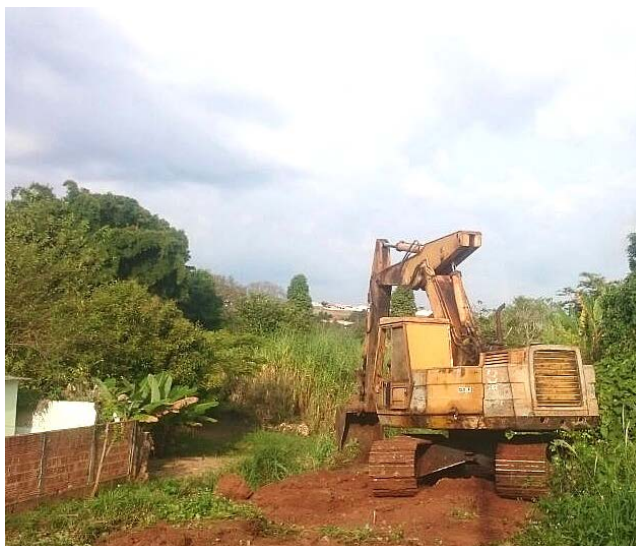
Córrego do Prata é o primeiro a receber limpeza

Locais não recebiam manutenção há cerca de 20 anos