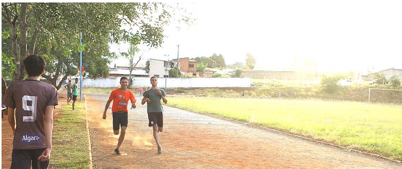
Atletas durante treinamento no ginásio Lauro Loureiro de Mello

Segundo a Coordenadoria Municipal de Esportes, os atletas possuem boa técnica e estão treinando a todo vapor. As expectativas são grandes. Itararé será representada em outro estado por excelentes atletas. Com esta oportunidade, além de valorizá-los, dá-se visibilidade ao município, o que se transforma em investimento ao esporte.