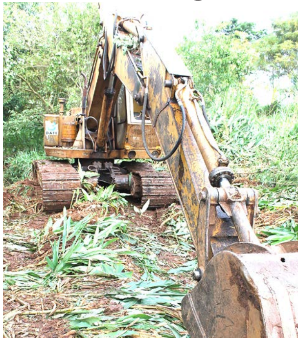
Retroscavadeira em ação no córrego do Prata. Os locais não recebiam limpeza há mais de 20 anos. Pág. 03