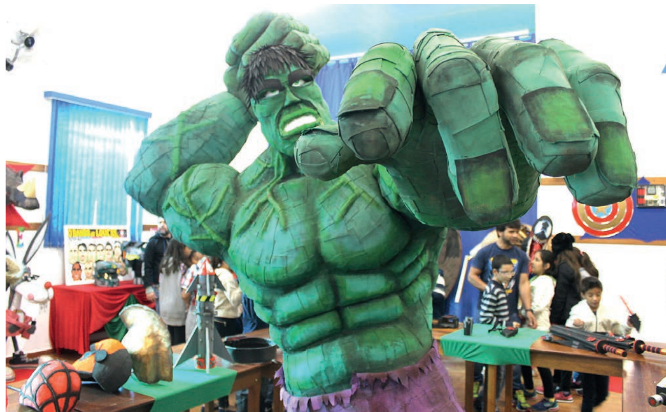
O super-herói Hulk é uma das peças mais apreciadas da exposição

Saiba mais – A ExpoArte tem como objetivo incentivar e apoiar o artista local, dando a ele oportunidade de expor seus trabalhos. Os interessados em participar devem procurar pela Coordenadoria Municipal da Cultura, localizada na rua XV de Novembro, 69 – Centro (próximo a Prefeitura)