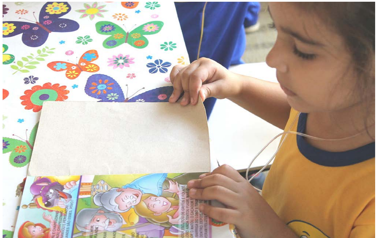
Aluna do Pré I em momento de viajar com as histórias encontradas nos livros