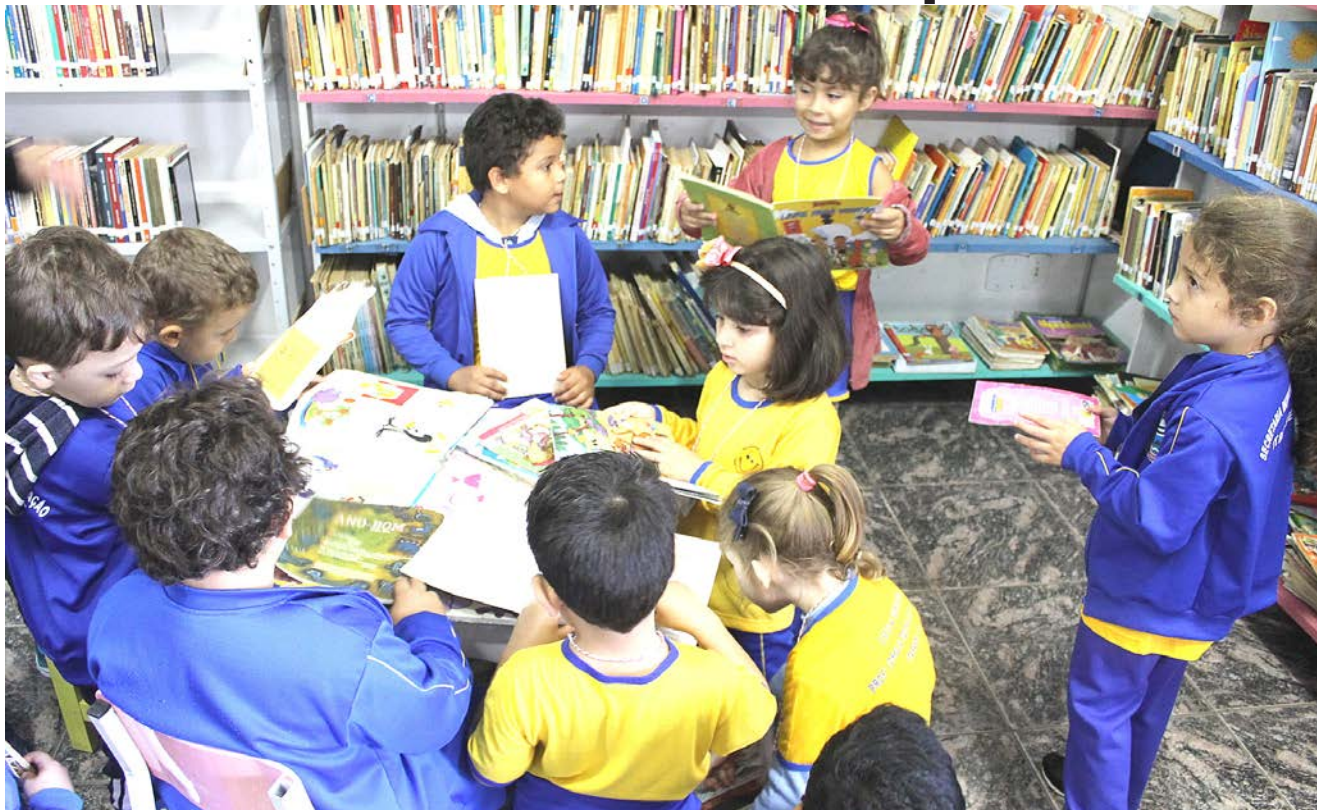
O passeio é uma forma de incentivar os alunos ao costume da leitura, além de apresentá-los a um espaço cultural ao qual muitos não tinham tido acesso Pág. 03