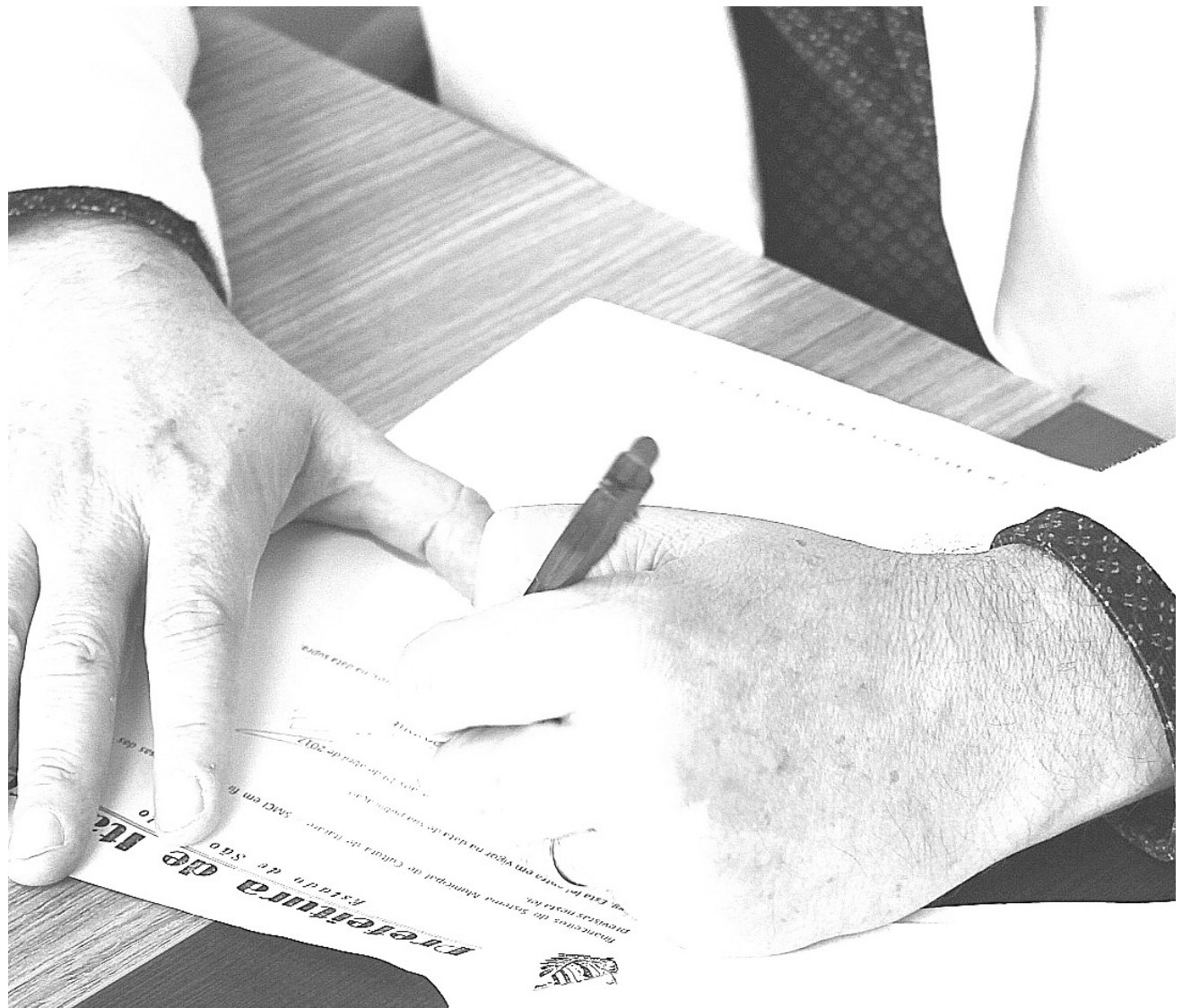
Finalidade é promover o desenvolvimento humano, social e econômico, com pleno exercício dos direitos culturais

A atual gestão entende que a cultura é essencial para a construção do indivíduo, por isso houve muito empenho dos envolvidos para abrir caminhos para que as transformações sociais comecem a acontecer.