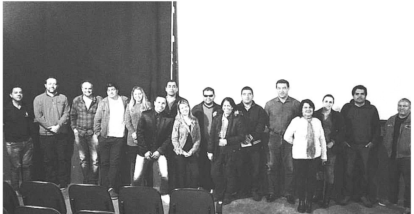
Ao todo, 14 pessoas compõem o grupo; integrantes têm mandato de dois anos

O próximo encontro, em data a ser divulgada, será para definir a mesa diretora.