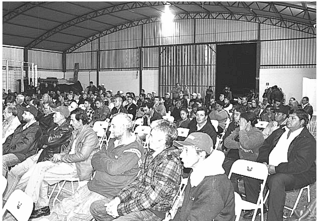
Evento reuniu cerca de 250 pessoas. Expectativa é lucro de até R$ 5 mil por produtor

Quem quiser saber mais informações sobre o projeto de implantação das granjas pode procurar a Secretaria Municipal de Agricultura, que fica na rua Frei Caneca, 1443, no Centro. O telefone é 15-3532-2457.