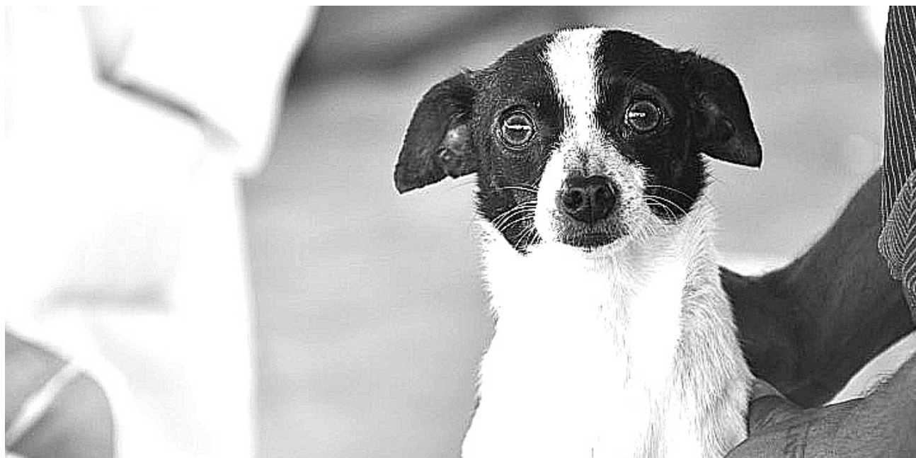
Além das consultas, os pets receberam remédios e vermífugos

Próxima edição do evento será no Jardim Paulicéia