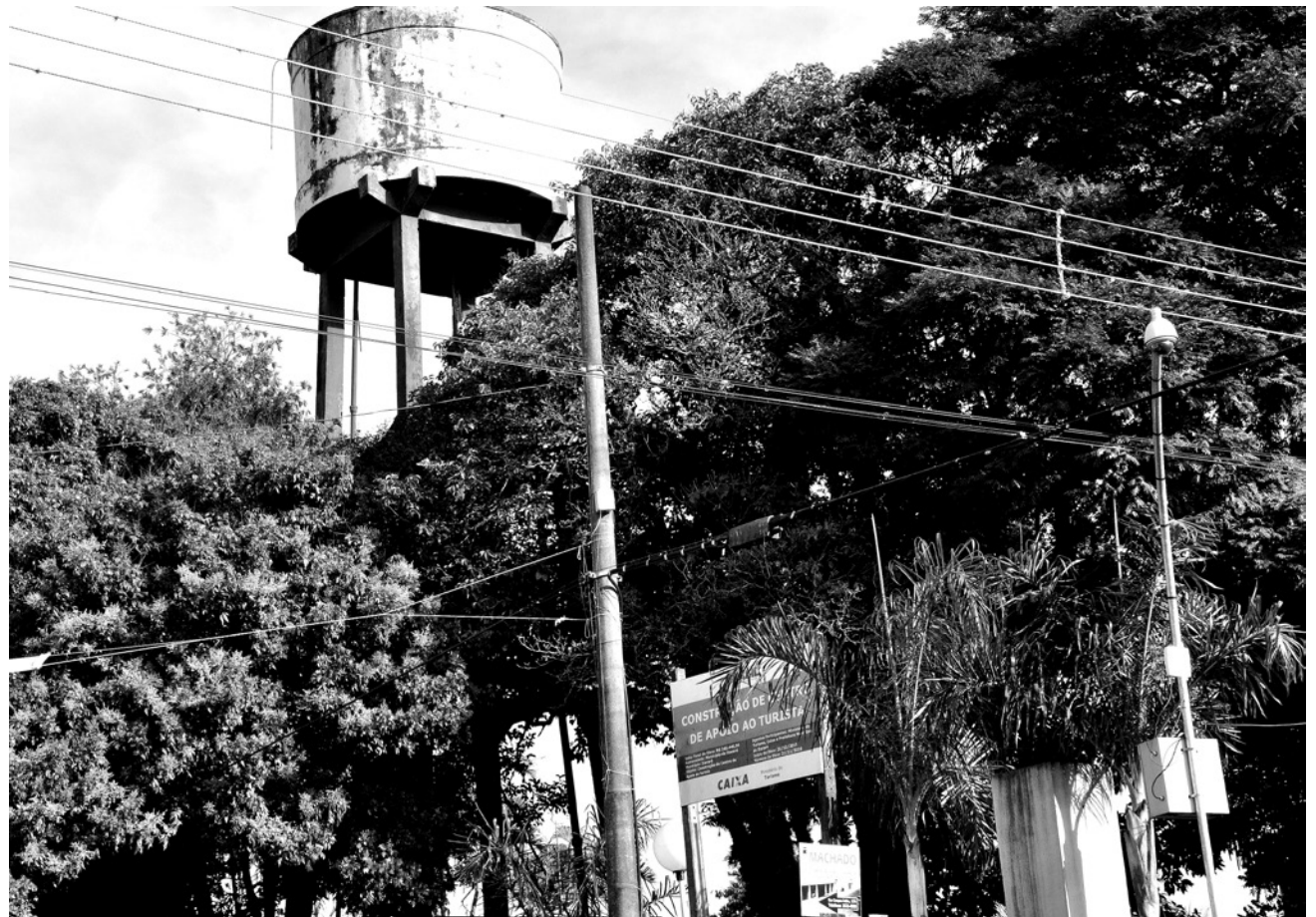
Investimento é de R$ 238 mil e as obras devem começar em breve

O plano diretor da pasta foi protocolado, junto à Assembleia Legislativa do Estado, cumprindo todas as exigências para que Itararé ingresse oficialmente no mapa turístico e, de acordo com a coordenadoria, a implantação do Centro de Apoio “não poderia vir em melhor hora”.