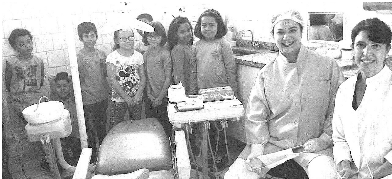
Dentistas em atendimento na Escola Maria da Silveira Vasconcelos