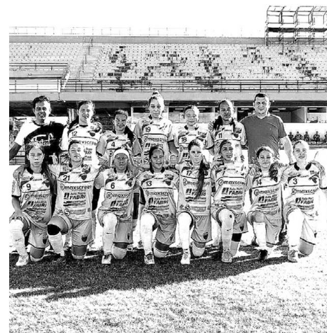
Partida será neste sábado (27) em Sorocaba contra Votorantim

A equipe feminina de Futebol de Itararé, categoria Sub 19, disputa a final dos Jogos Abertos da Juventude fase regional neste sábado (27).