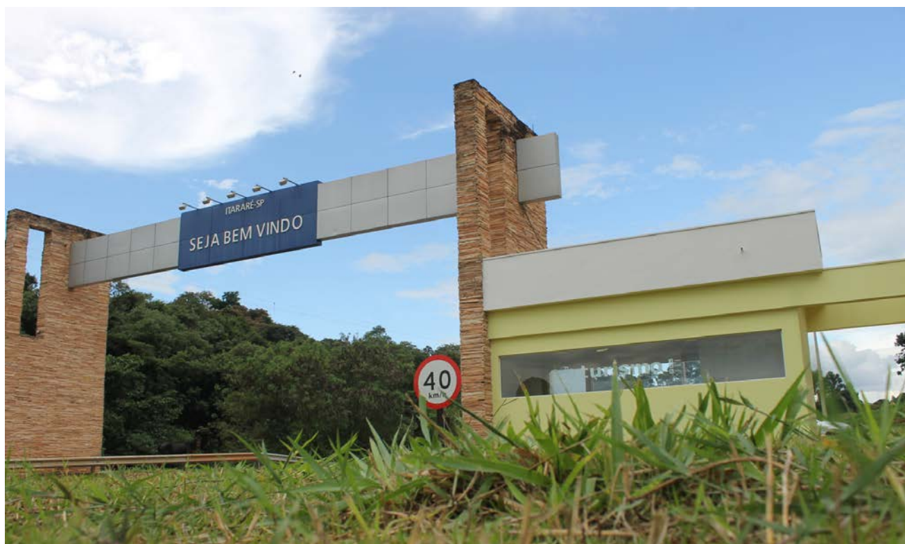
Itararé já conta com infraestrutura para atender visitantes e turistas

O título de MIT proporcionará ao município um status diferenciado que contribuirá para aumentar o nível de confiabilidade em investimentos em diferentes áreas. Além disso, o município poderá contar com um recurso anual de R$ 650 mil.