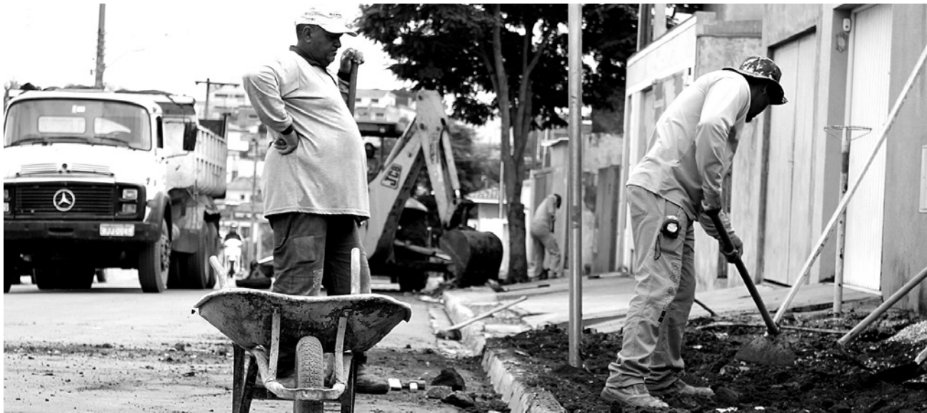
Construtora implanta calçadas em duas ruas do bairro

A Prefeitura de Itararé retomou o projeto de pavimentação no Parque Centenário, onde a construtora está realizando a colocação de calçadas. A estrutura segue o padrão recomendado de acessibilidade.