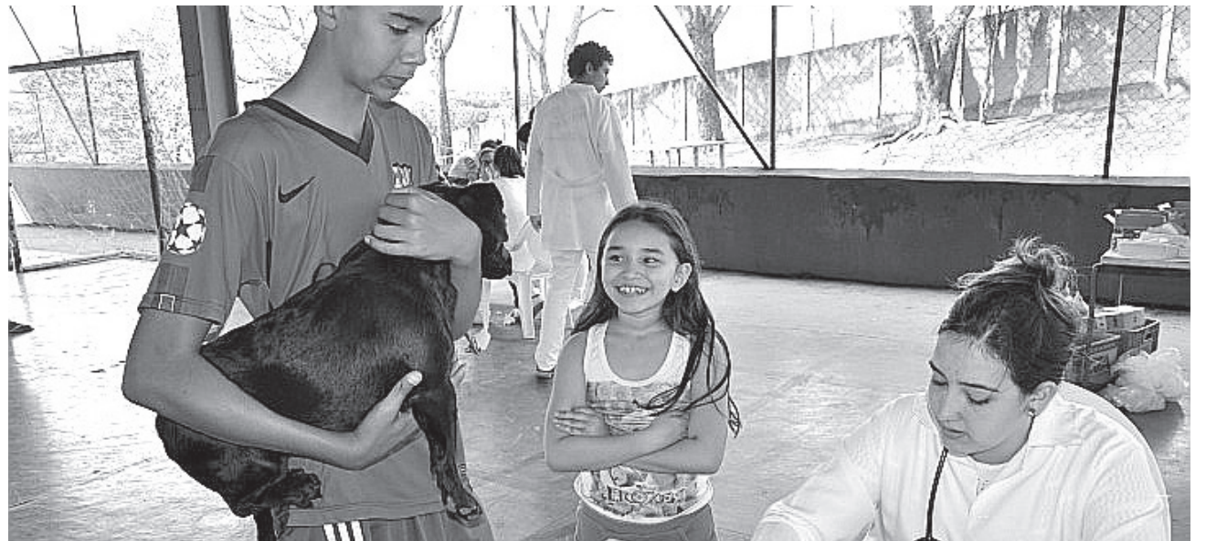
Última edição foi na Vila Novo Horizonte , onde mais de 160 animais foram atendidos

Informações sobre o projeto podem ser obtidas na Secretaria Municipal de Agricultura, que fica na rua Frei Caneca, 1443 – Centro.