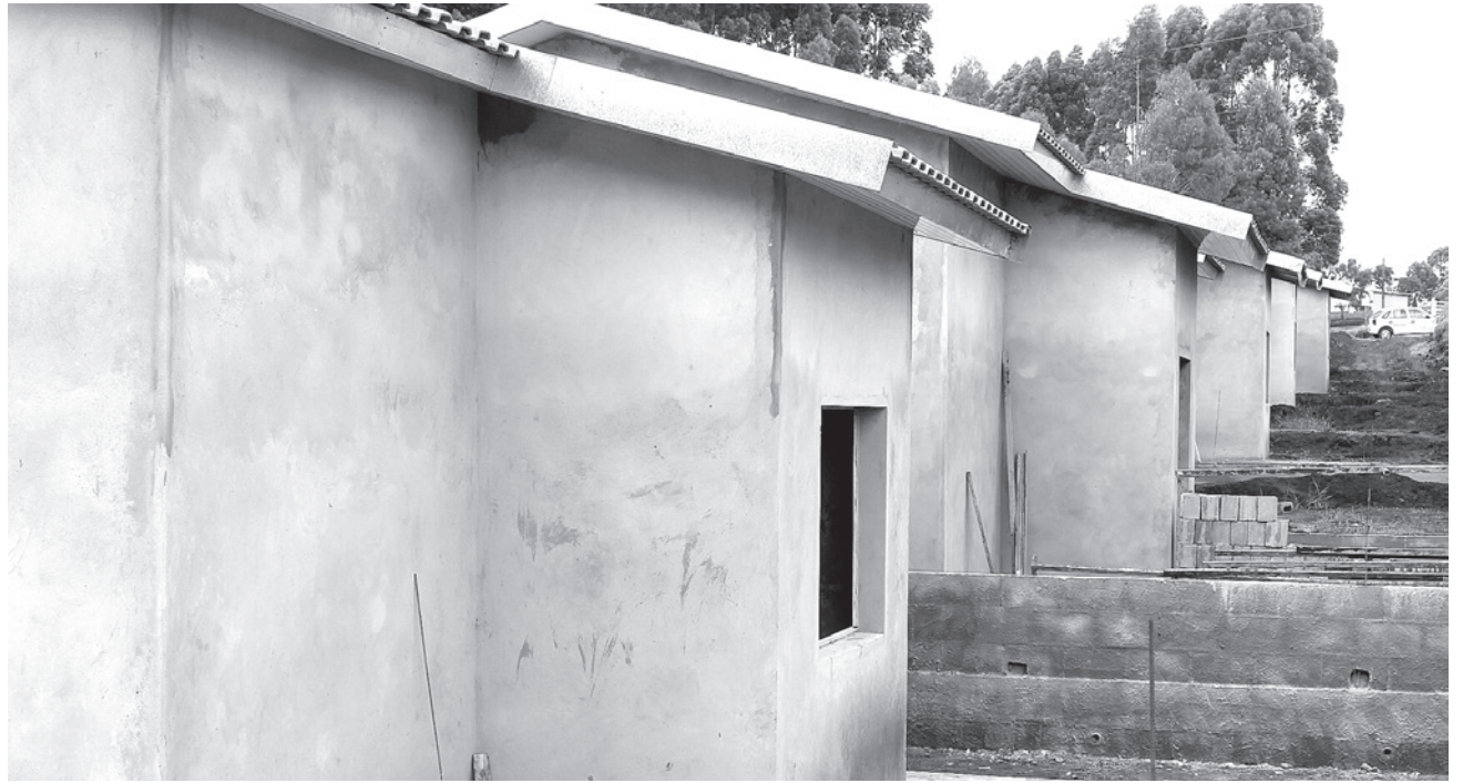
Boa parte das residências já está com telhado e piso

O Conjunto Habitacional Itararé E terá um investimento de aproximadamente R$ 20 milhões e contribuirá com a redução do déficit habitacional do município, beneficiando diretamente mais de mil e trezentas pessoas.