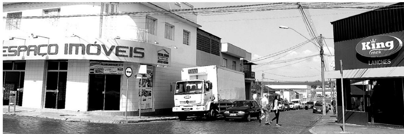
Rua Treze de Maio passa a ser mão dupla entre as ruas Frei Caneca e XV de Novembro