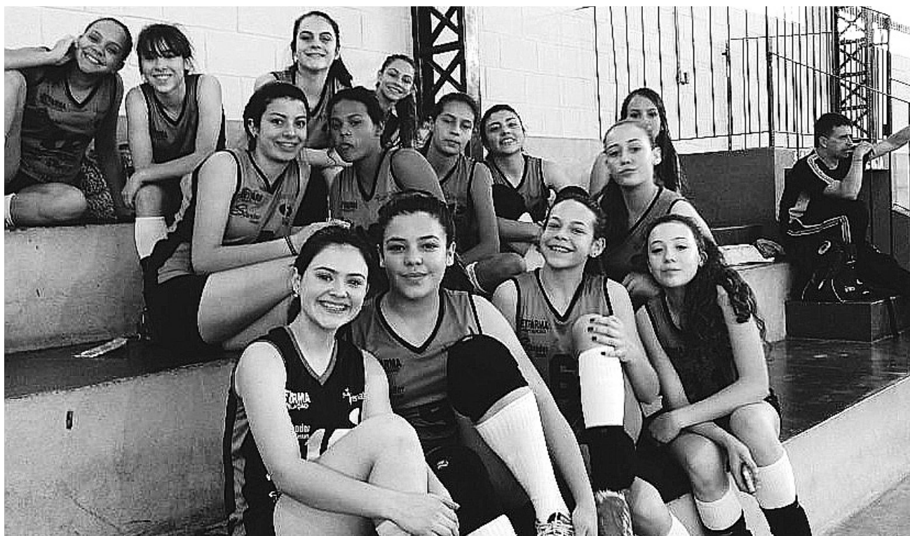
Grupo enfrentou Boituva e Pilar do Sul

A equipe feminina de Vôlei de Itararé, categoria mirim, venceu o festival da Liga Sorocabana de Voleibol em Pilar do Sul (SP) no último sábado (12).