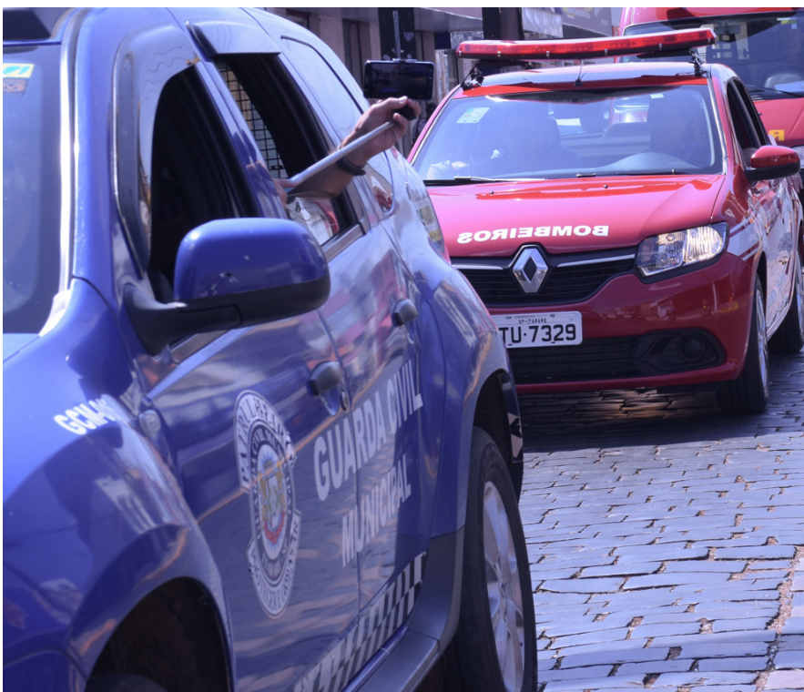
Veículo vem reforçar a frota municipal de segurança no município

O prefeito de Itararé (SP) entregou no dia 6 deste mês um Logan Expression 1.6 16 V, ano 2017, modelo 2018, da Renault à base do Corpo de Bombeiros do município. O novo veículo, no valor um pouco mais de R$ 54 mil, foi adquirido com recursos próprios e será utilizado para apoio operacional na instituição.