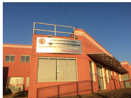
Casa dos Renais, em Itapeva

de Nefrologia apontam que cerca de dez milhões de brasileiros tenham algum problema renal. Deste número, mais de 100 mil precisam fazer hemodiálise.