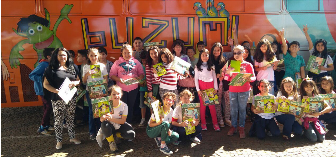
Parte dos estudantes que participaram do projeto promovido pela Prefeitura de Itararé e a CCR-Vias