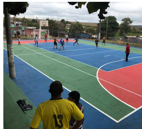
Quadra da Escola foi utilizada durante a torneio de futebol