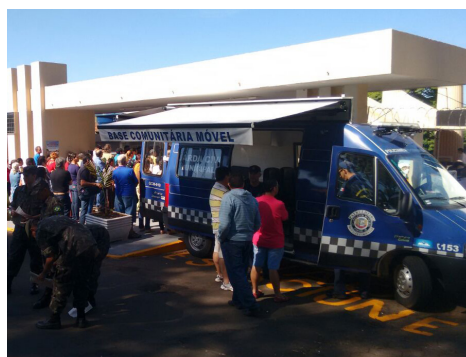
Operação realizada pela GCM

10 mil pessoas e 4 mil veículos passaram pelo local na data. “Durante o período de atendimento, nenhuma ocorrência foi registrada”, informou o comandante.