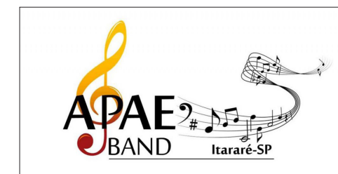
Banda é composta por alunos e professores da instituição

Saiba mais - O retorno da festa foi uma solicitação do prefeito de Itararé à Coordenadoria Municipal de Cultura que está empenhada desde o mês de setembro no pedido.