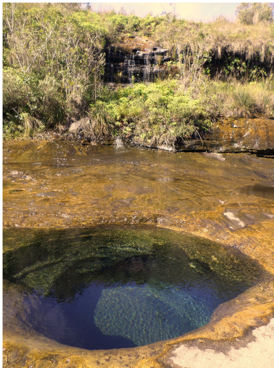
O Rio Verde oferece apoio para alimentação próximo à Rodovia SP-258

Com paredões rochosos que alcançam 100m de altura a Serra da Lumber alcança a altitude de 1200m,