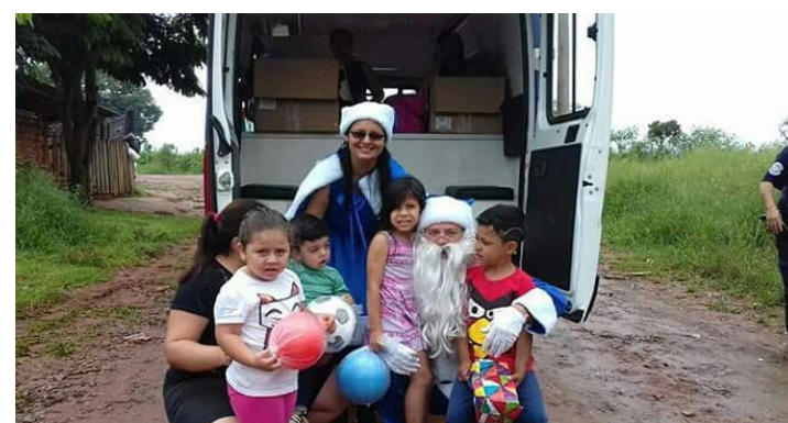
A distribuição ocorreu na Vila Novo Horizonte, Jd Bequinha, Jardim Paulicéia, Vila Esperança e Jardim Fronteira