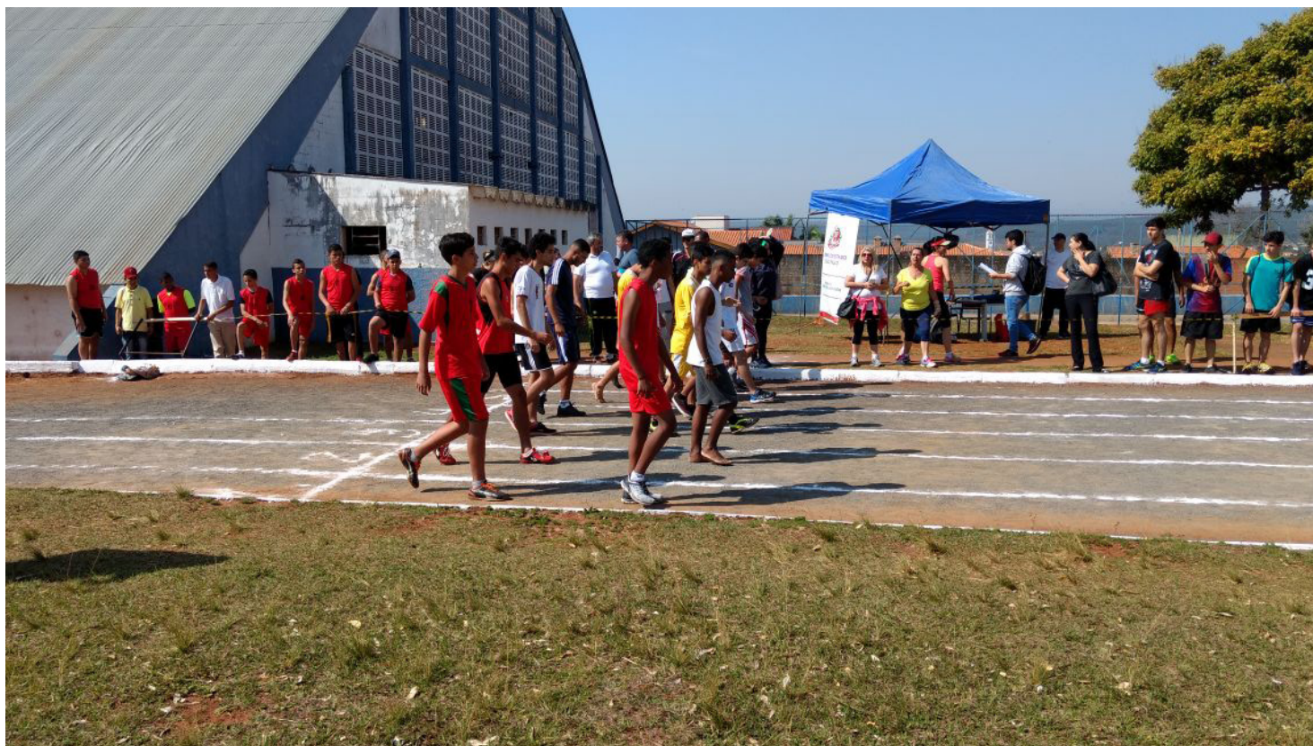
Retorno de algumas atividades esportivas foi uma das conquistas da gestão atual

gos Abertos do Interior nas modalidades Damas misto e Futsal masculino; - Nos Jogos Abertos do Interior disputados no ABC Paulista (SP), Itararé conquistou o 5º lugar na Damas misto e 8º lugar no Futsal masculino.