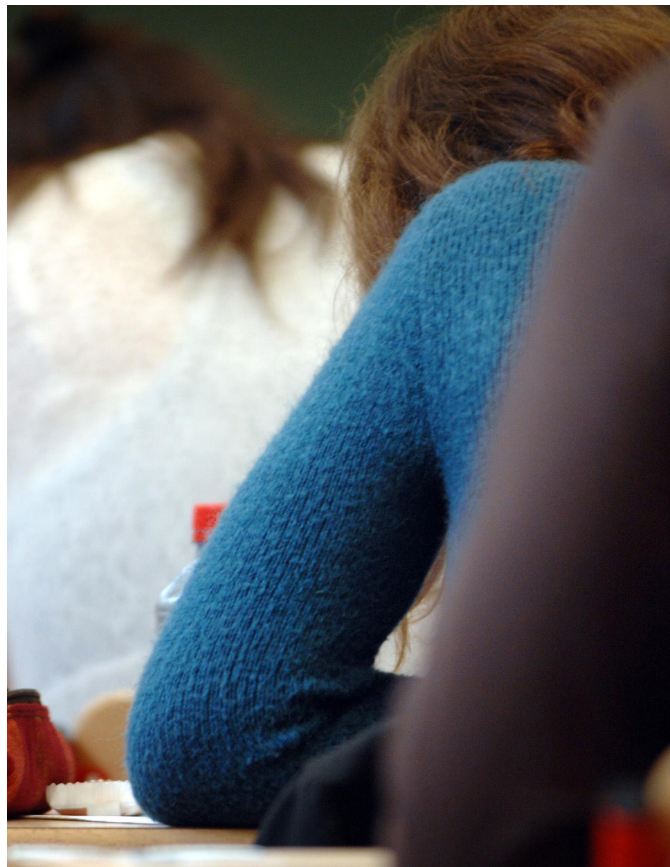
As provas do concurso público serão aplicadas no dia 18 de fevereiro