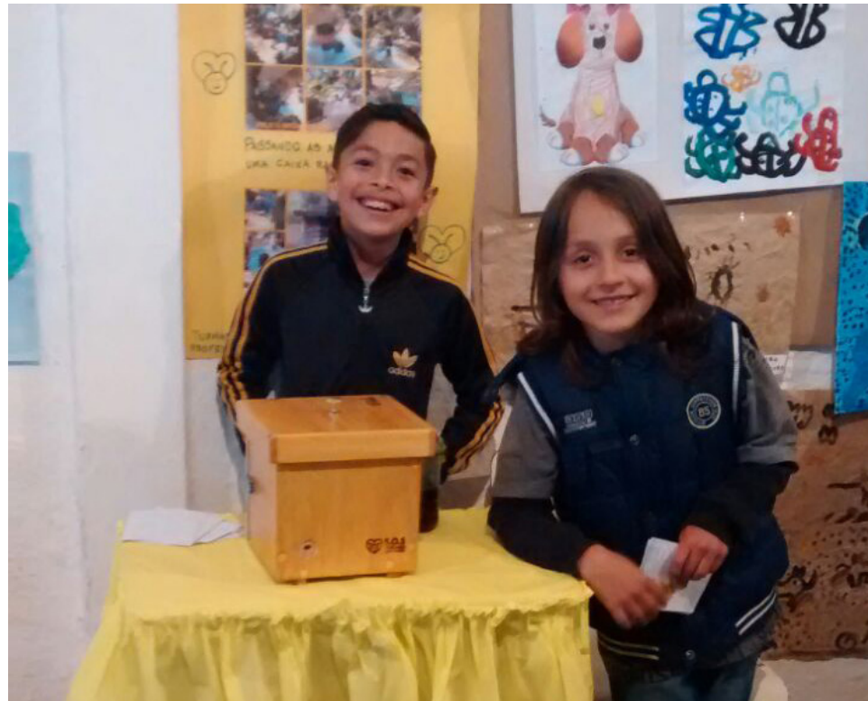
Abelhas moram em caixinhas e convivem em harmonia com as crianças