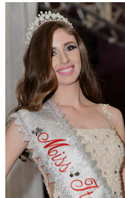
A miss Itararé tem 19 anos

depois de anos, voltar a realizar o evento. Em todas as viagens e apresentações, a Miss conta com apoio 100% da Prefeitura.