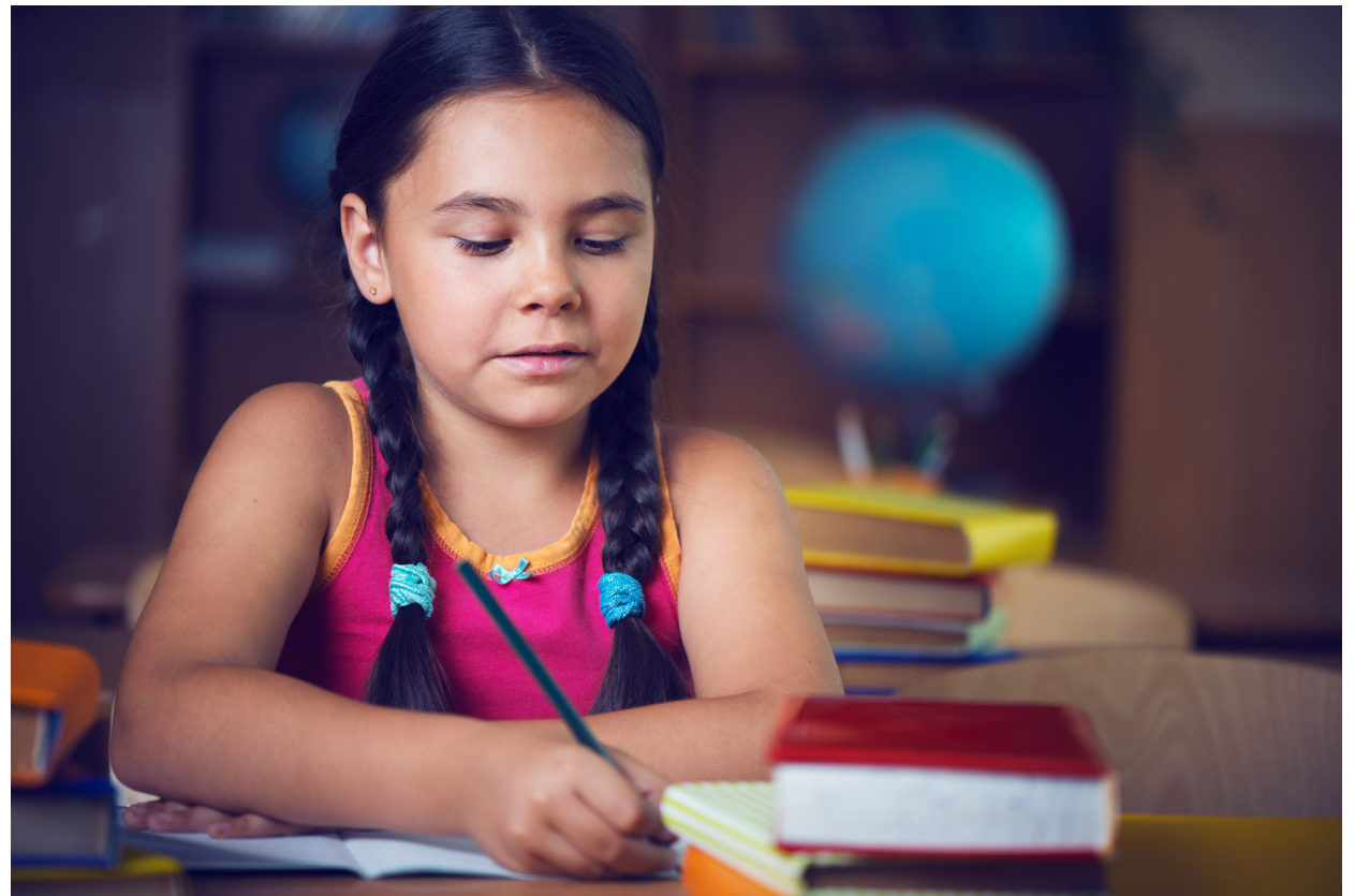
Cerca de 1.100 alunos da rede municipal serão beneficiados