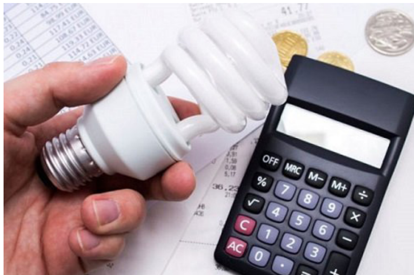
Alunos apresentaram projeto para redução da conta

Conforme eles, a medida tem como objetivo reduzir os custos com a energia, não causando danos ambientais, pois faz uso