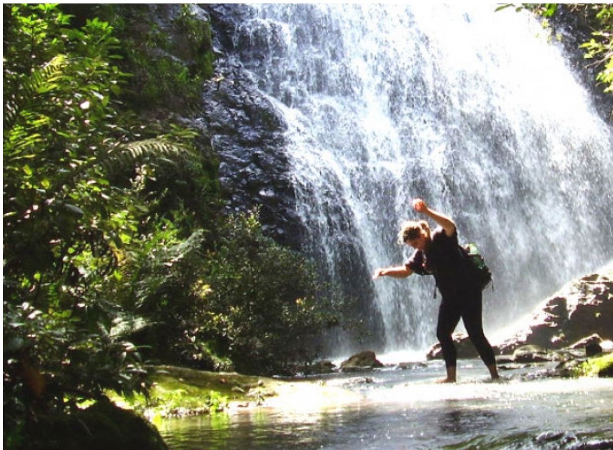
Organização dos serviços do turismo na cidade favoreceu a atração dos turistas

Para saber mais sobre os roteiros atrativos da cidade de Itararé acesse o link: http://bit.ly/2t0HFux