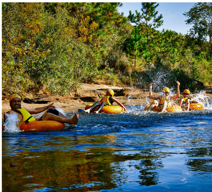
Ação beneficia turistas e também os profissionais da área

ações do Ministério do Turismo; • Visibilidade nos sites do Cadastur e do Programa Viaje Legal.