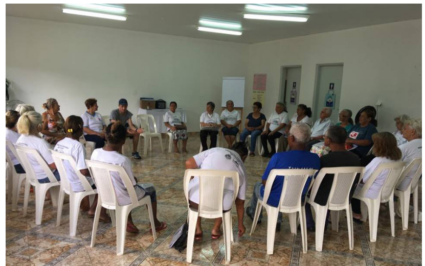
Todas as oficinas serão ministradas por profissionais capacitados, resultando num total de 90 horas aula

"Buscamos promover ações que colaborem com o desenvolvimento da autonomia, sociabilidades, no fortalecimento dos vínculos familiares e do convívio comunitário. Esta parceria é uma delas", explica a secretária.