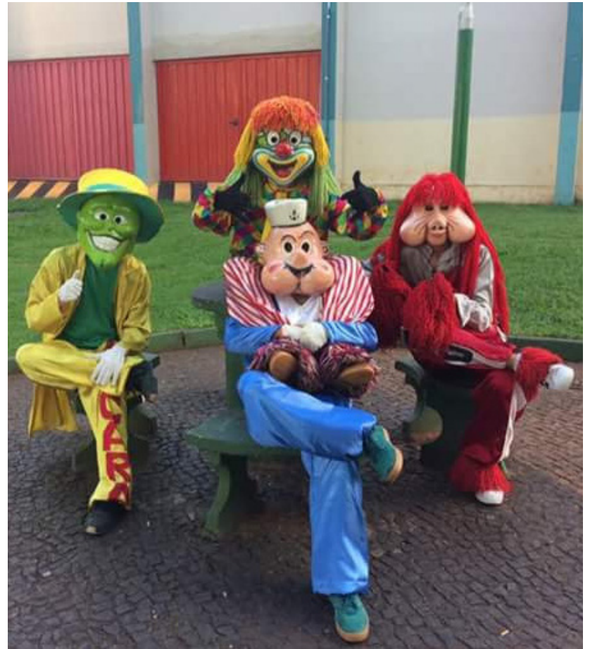
Ônibus conta com a animação de diversos personagens