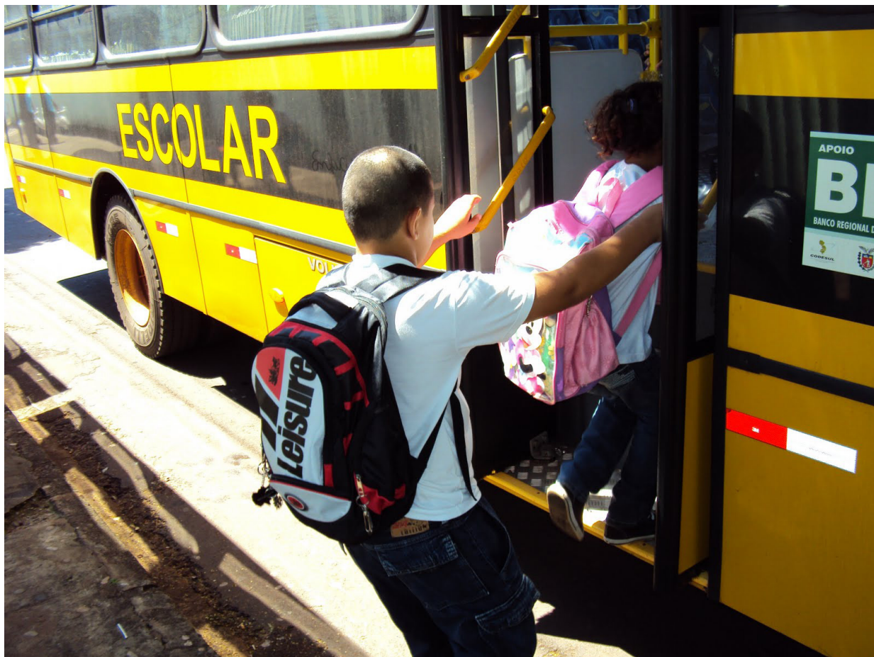
Ao todo, 10 escolas são atendidas, além do Centro Educacional Especializado de Itararé

O município dispõe de frota própria e veículos terceirizados, que englobam van, micro-ônibus e ônibus. O setor conta com 17 servidores municipais.