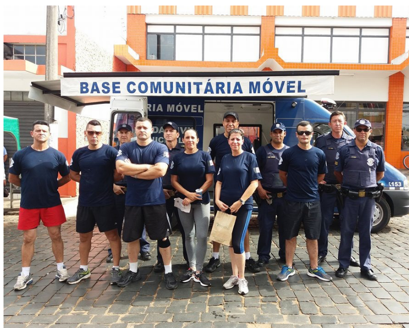
A corporação colaborou com a segurança dos atletas

Para o comandante da Guarda, apoiar iniciativas que têm por intuito ajudar a comunidade sempre é satisfatório. "Estamos e sempre estaremos à disposição da população", finalizou