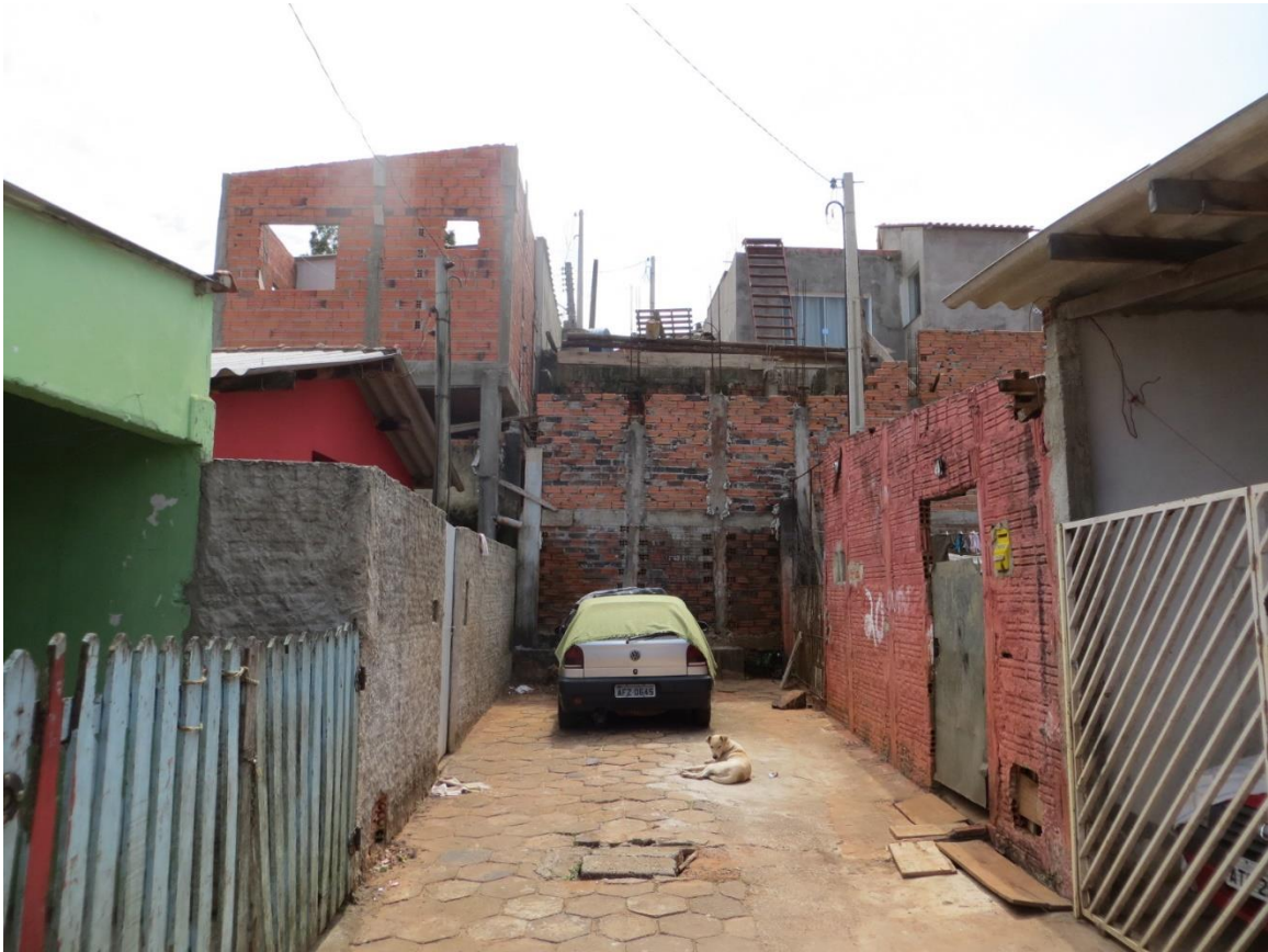
Figura 6: Setor de risco nº 04 – Encosta com direção Leste-Oeste no fim das ruas Beco da Paz e Beco da Felicidade, Bairro Vila Esperança. Moradias ocupando área de crista e base de talude de corte vertical, sem obras de contenção ou drenagem de crista adequadas. Ocorrência de deslizamentos de solo frequentes em períodos chuvosos. Necessária realização de obra de contenção adequada.