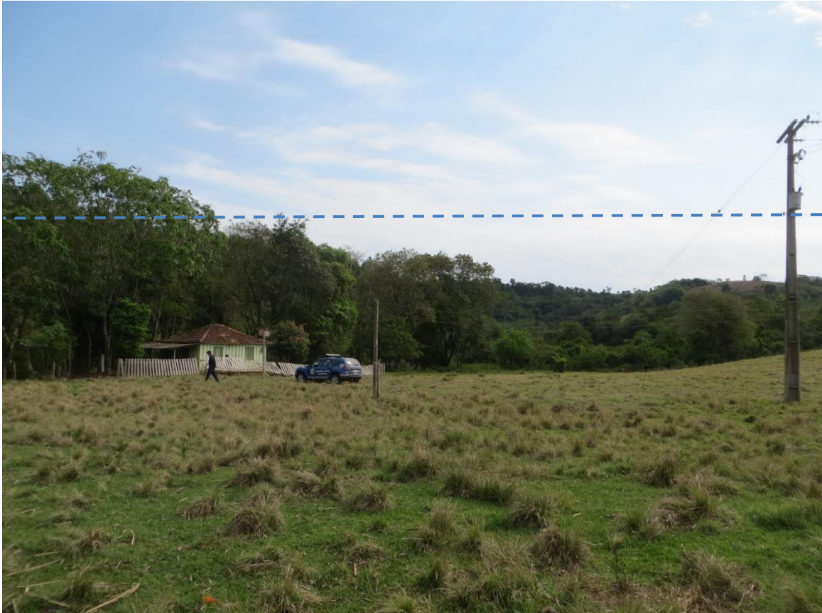
Figura 14: Sítio Barrinha, Santa Cruz dos Lopes, Planície de inundação do Rio Itararé. Moradia atingida por inundação em janeiro de 2016, com lâmina d'água ultrapassando 10 m, atualmente desocupada. Necessária implementação de alerta de cheias.