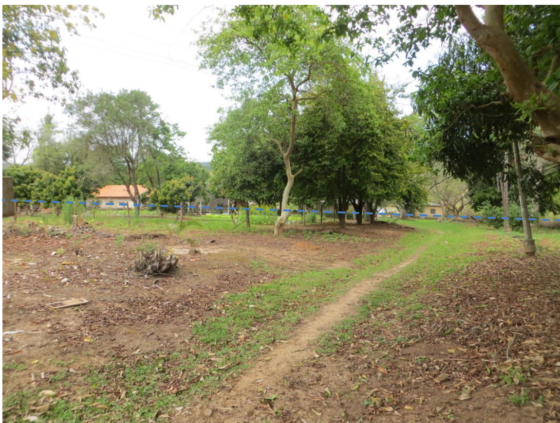
Figura 4: Setor de risco nº 02 –Planície de Inundação do Córrego Faxinete na confluência com o Rio Itararé, no distrito de Santa Cruz dos Lopes. Moradias ocupando a planície de inundação sem adaptação adequada para o regime de constantes inundações. É necessário que essas áreas rurais em planície sejam ocupadas por moradias adaptadas ao constante regime de inundações natural dos rios, por exemplo, moradias sobre pilotis. Último evento ocorrido em janeiro de 2016, com lâmina d'água atingindo as moradias mais próximas ao córrego.

adequada para o regime de constantes inundações. É necessário que essas áreas rurais em planície sejam ocupadas por moradias adaptadas ao constante regime de inundações natural dos rios, por exemplo, moradias sobre pilotis. Último evento em janeiro de 2016, com lâmina d'água chegando a mais de 0,5m em algumas moradias, com destruição de acessos.