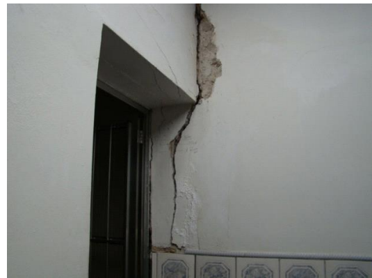
Rachadura em processo de abertura por instabilidade do solo sob a moradia, Rua Jundiáí, Santo André-SP