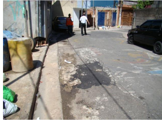
Trincas no asfalto, em área de crista de encosta, Núcleo Capuava, Santo André-SP