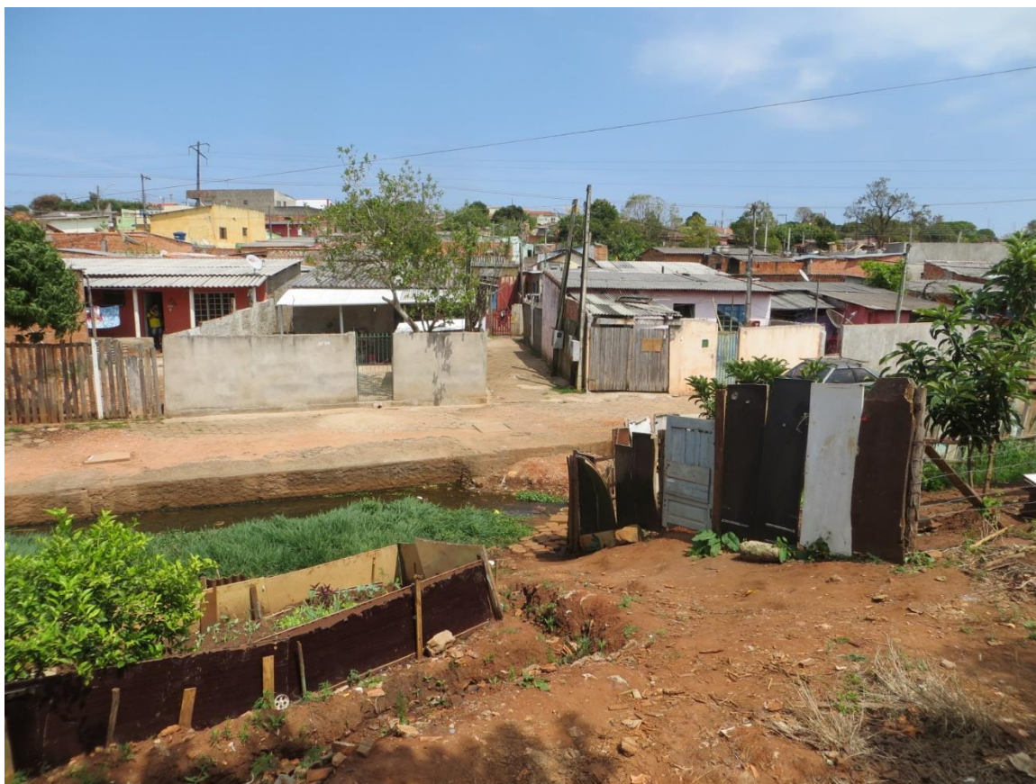
Figura 5: Setor de risco nº 03 – Planície de inundação do Córrego dos Lavapés, na Vila Esperança. Moradias ocupando área naturalmente inundável do córrego, por vezes na calha do córrego, sujeitas às constantes inundações e com danos materiais. Eventos recorrentes sempre em períodos chuvosos atingindo as moradias. Necessária remoção das casas mais próximas à calha do córrego.