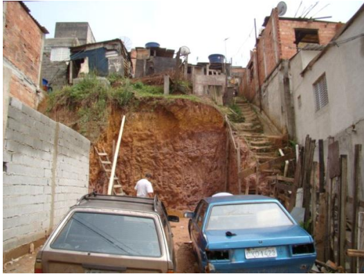
Talude de corte vertical sem impermeabilização ou drenagem de crista com muito alta probabilidade de erosão e deslizamento de solo, devido ao lançamento de águas na encosta, Bairro Espírito Santo, Santo André-SP.