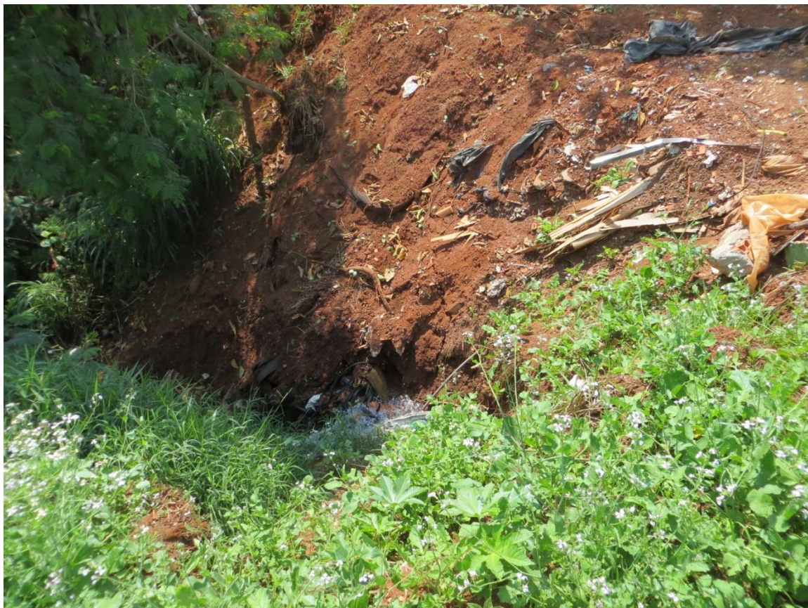
Figura 12: Setor de risco nº 06 – Jardim Paulicéia, nascente do córrego da prata. Todas as cabeceiras de drenagens ou nascentes são consideradas áreas de proteção permanente (APPs) e não podem ser ocupadas pela urbanização. O aterramento das áreas de cabeceira com aterros lançados de resíduos comprometem o curso d'água e as próprias moradias situadas sobre essas áreas. A situação pode evoluir para processos erosivos como ravinamento e até formação de boçorocas.

seção hidráulica no córrego Lavapés. As passagens sobre os cursos d'água de acessos urbanos devem ser feitas levando em consideração à vazão anômala em dias de elevada precipitação. O subdimensionamento dessas passagens somado ao assoreamento do córrego acarretam em represamento das águas, solapamento das margens, destruição dos acessos e comprometimento estrutural em moradias próximas aos cursos d'água.