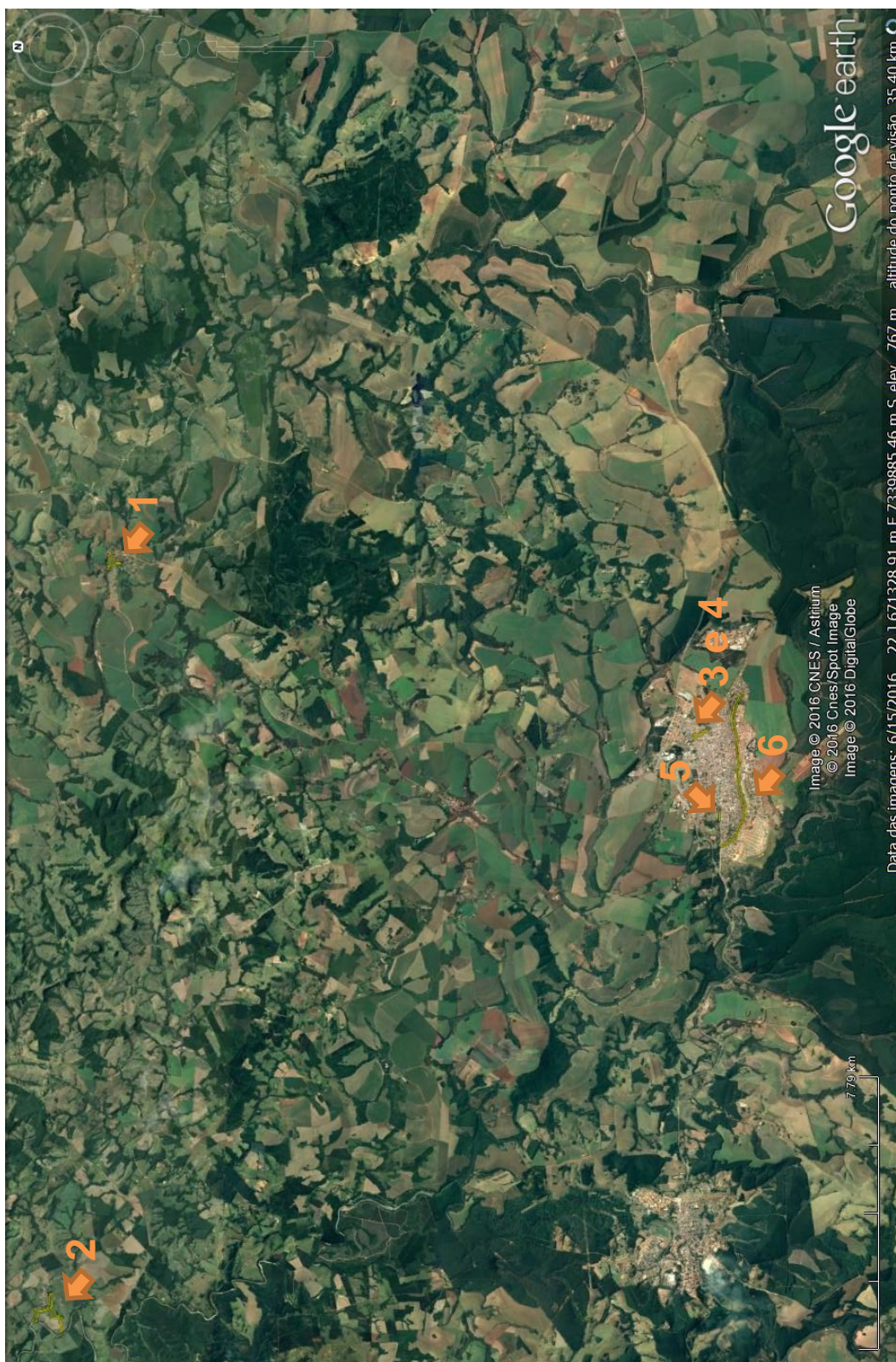
Figura 2: Em destaque os setores de risco do município de Itararé, SP verificados nesta etapa de campo realizada em setembro de 2016.