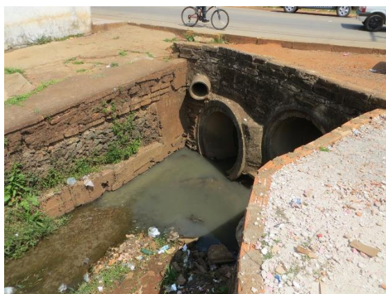
Figuras 10 e 11: Setor de risco nº 06 – Vila Novo Horizonte e Setor de Risco nº 03 - Vila Esperança, assoreamento do córrego da prata e subdimensionamento da