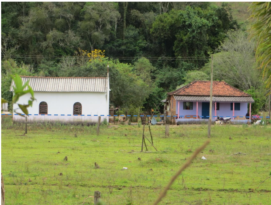
Figura 3: Setor de risco nº 01 – Planície de Inundação na confluência do Córrego do açude, Ribeirão Nha Belina com o Ribeirão da Pedra Branca, no distrito de Pedra Branca. Moradias ocupando a planície de inundação sem adaptação

Segue abaixo a descrição dos setores visitados e suas principais características.