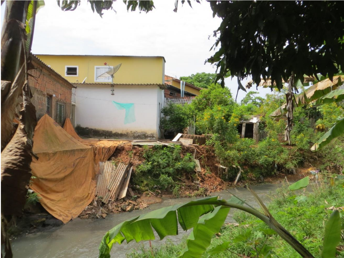
Figura 8: Setor de risco nº 06 – Planície de inundação do Córrego da Prata, na Vila Novo Horizonte. Moradias ocupando área naturalmente inundável do córrego, sujeitas às constantes inundações e solapamento de margens. Necessária remoção dessas moradias.