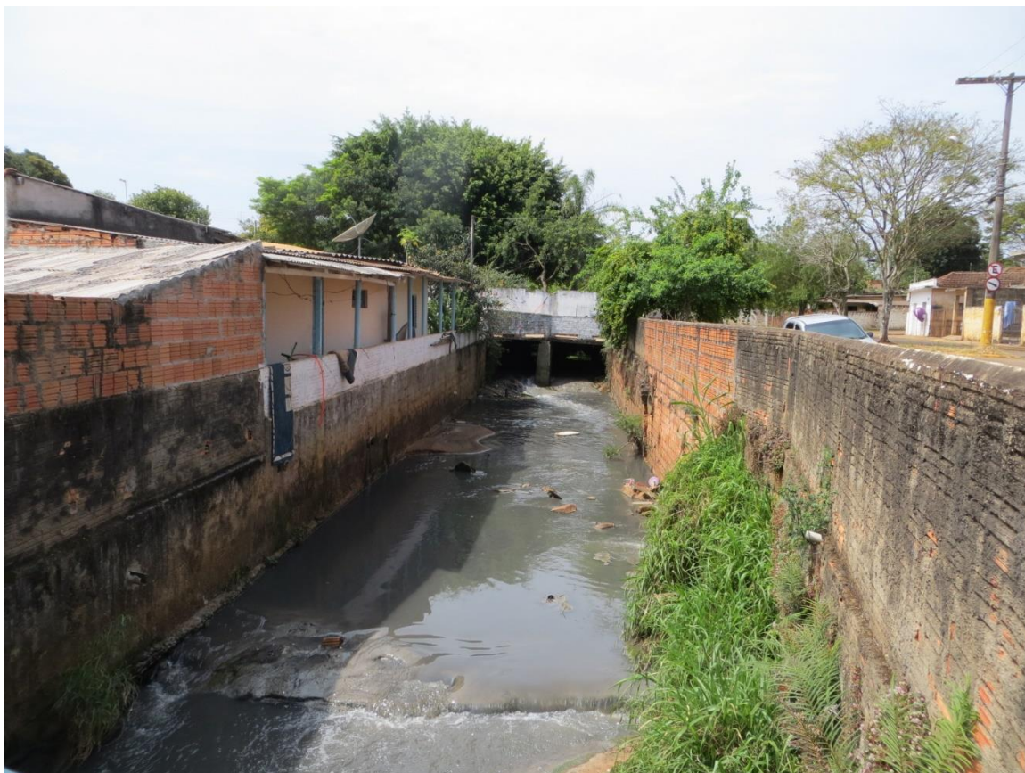
Figura 9: Setor de risco nº 06 – Planície de inundação do Córrego da Prata, Bairro Velho. Moradias ocupando área naturalmente inundável do córrego, sujeitas às constantes inundações e solapamento de margens. Necessária remoção dessas moradias.

Destacam-se dentre os problemas construtivos agravantes de risco às situações exemplificadas, a seguir.