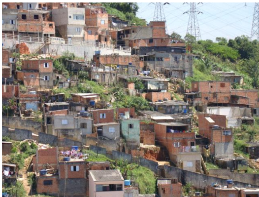
Ocupação desordenada em áreas de encostas mais íngremes, sucessivos cortes de talude, falta de saneamento básico e precariedade/vulnerabilidade construtiva das moradias, Jardim Irene, Santo André-SP