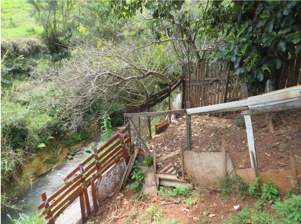
Figura 7: Setor de risco nº 05 – Margem esquerda do Córrego do Tatit, na Vila Jurandir, paralelo a Rua Belizario Pinto. Moradias de alta vulnerabilidade construtiva, ocupando área de margem do córrego, por vezes muito próximas da calha do córrego e sobre aterro lançado. Foram encontrados indícios de erosão e movimentação do solo. Local com alto potencial a solapamento de margens e comprometimento estrutural das moradias.