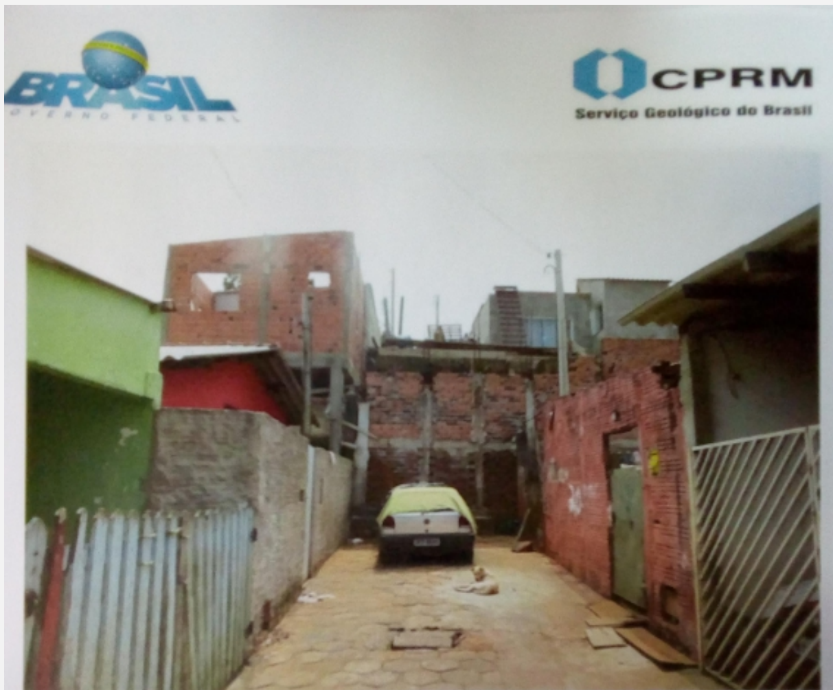
Figura 6: Setor de risco nº 04 – Encosta com direção Leste-Oeste no fim das ruas Beco da Paz e Beco da Felicidade, Bairro Vila Esperança. Moradias ocupando área de crista e base de talude de corte vertical, sem obras de contenção ou drenagem de crista adequadas. Ocorrência de deslizamentos de solo frequentes em períodos chuvosos. Necessária realização de obra de contenção adequada.

Localidade: SETOR 4 - BAIRRO VILA ESPERANÇA ENCOSTA BECO DA PAZ