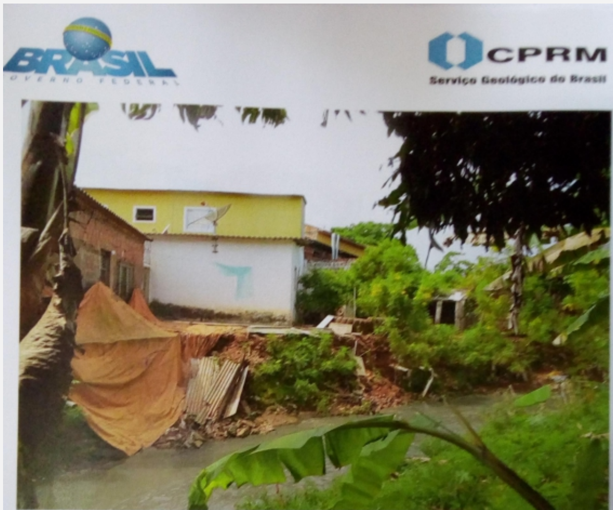
Figura 8: Setor de risco nº 06 – Planície de inundação do Córrego da Prata, na Vila Novo Horizonte. Moradias ocupando área naturalmente inundável do córrego, sujeitas às constantes inundações e solapamento de margens. Necessária remoção dessas moradias.

Localidade: SETOR 6 - MARGENS DO CÃRREGO DA PRATA CÓRREGO PRATA VNH