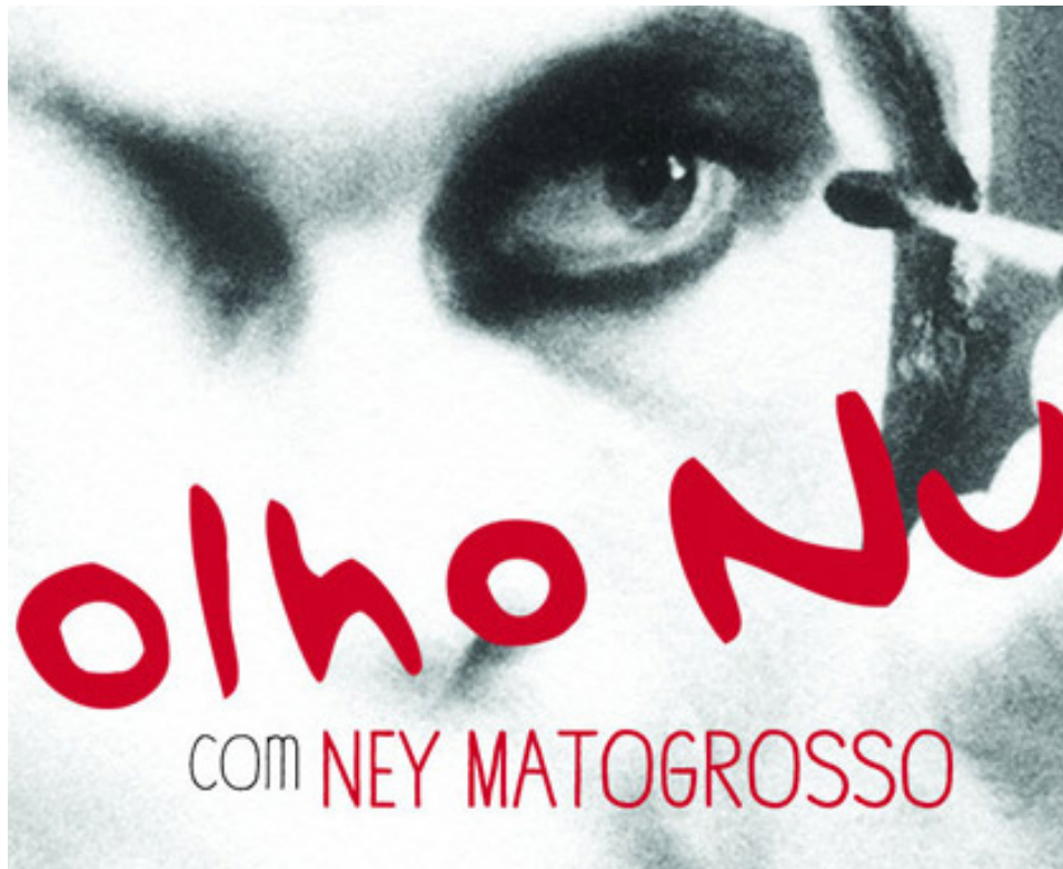
Filme retrata a vida e a obra de Ney Matogrosso a partir de um conjunto de imagens e sons reunidos pelo artista

O filme retrata a vida e a obra de Ney Matogrosso a partir de um conjunto de imagens e sons reunidos pelo artista. Em um espetáculo sobre seu percurso musical, o longa evoca sua história nos palcos.