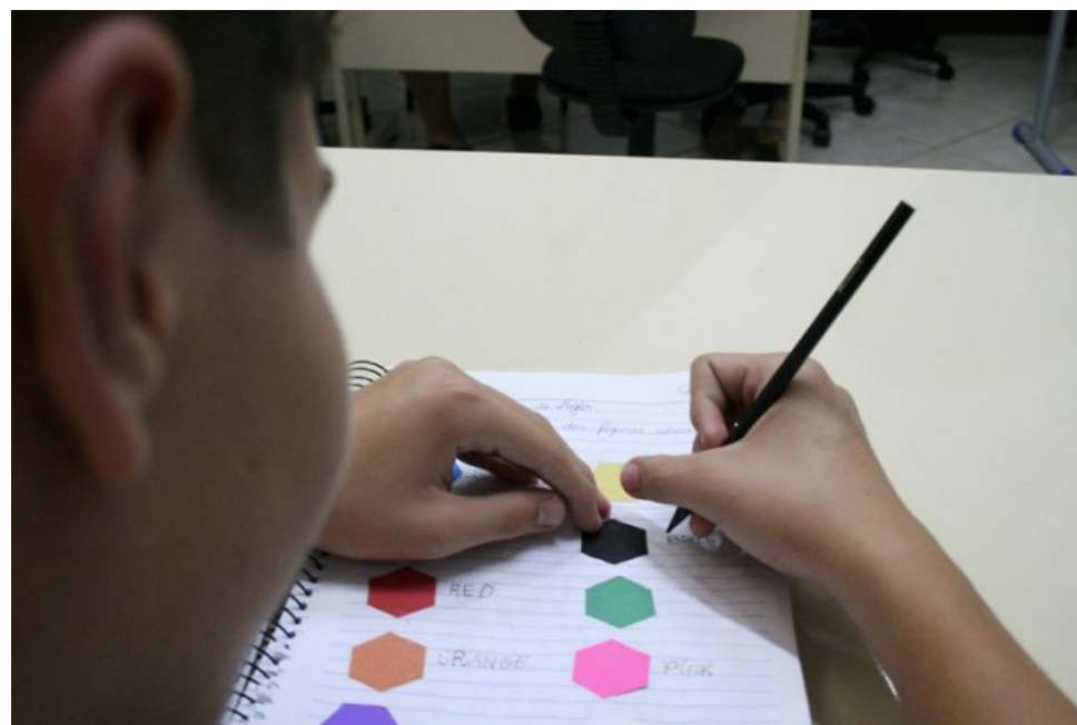
Escolinha já conta com 40 crianças nos treinamentos

A iniciativa teve por meta orientar os profissionais, para aprimorá-los em seu repertório de conhecimentos