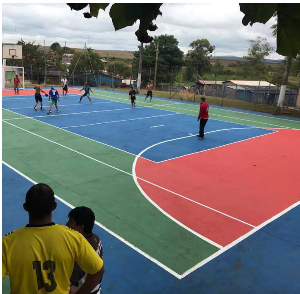
Alunos utilizam a quadra da Escola durante a torneio de futebol

A quadra é utilizada por dezenas de alunos. A nova pintura garante a sinalização adequada para a prática esportiva, o que vem ao encontro dos projetos da administração pública, que é oferecer todas as condições para que a população tem mais qualidade de vida e bem-estar.