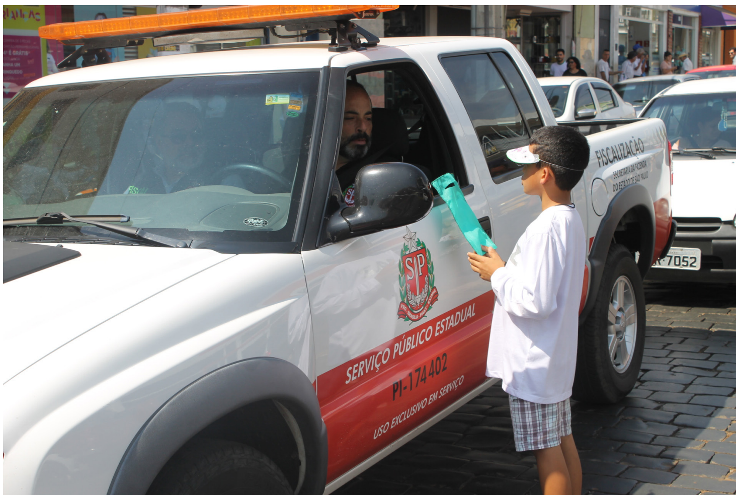
Projeto promoveu a entrega de panfletos sobre o trânsito aos motoristas e pedestres na Rua São Pedro

Desenvolvido pela Fundação Mafre e coordenada pelo Núcleo de Programas Permanentes do DETRAN-SP, o programa envolveu 12 escolas do Ensino Fundamental que desenvolveram projetos que visavam as relações entre diferentes grupos, focando temas como meio ambiente e a convivência em espaços públicos, em busca de soluções para auxiliar nos elevados índices de acidentes de trânsito a partir de ações educativas preventivas.