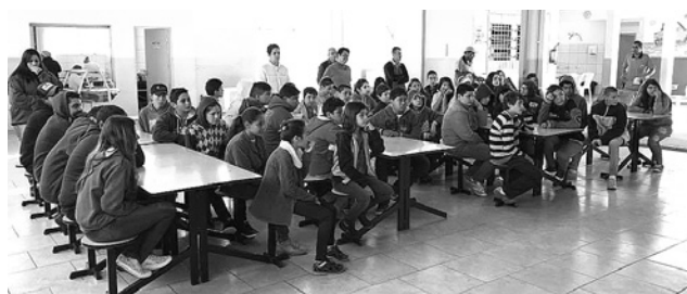
Mais de 6 mil alunos receberão a benfeitoria

O material foi adquirido antes mesmo do recesso e é composto por materiais básicos à educação.