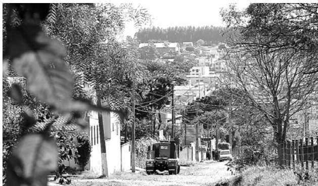
Duque de Caxias é uma das ruas contempladas. Moradores do CDHU serão beneficiados.

Segundo a Coordenadoria Municipal de Planejamento, o projeto está aguardando a liberação do governo do estado para abertura de licitação da empresa que irá executar a obra.