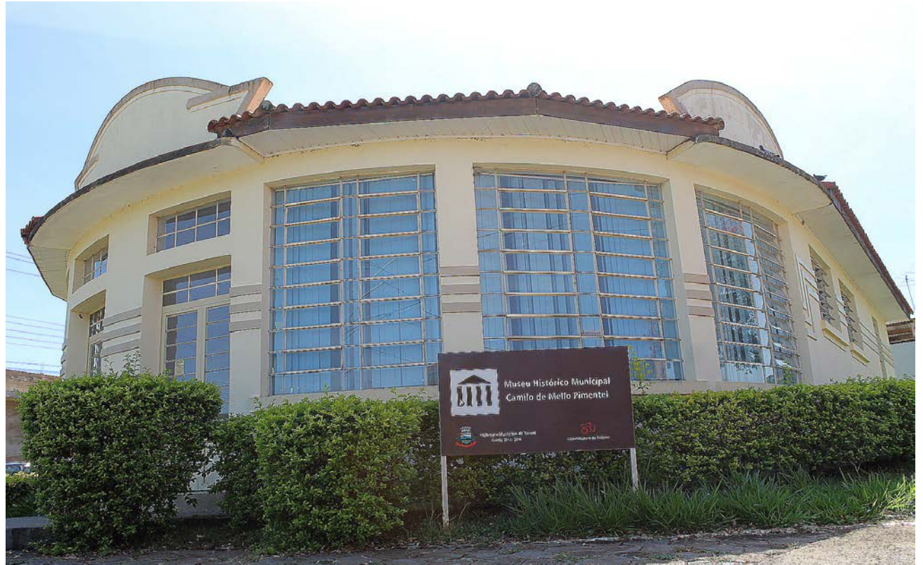
Com acervo que preservam a história do município, o local é uma ótima opção de passeio

Visitas passarão a ser quintas e sextas-feiras ou com agendamento