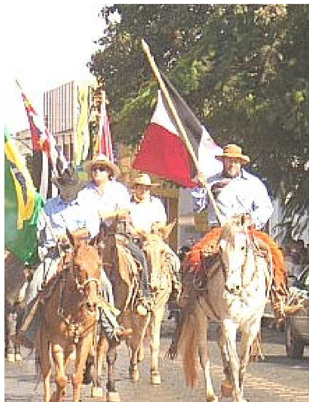
Os tropeiros percorrerão mais de 400 km durante o percurso

A 12ª edição da Tropeada Itararé à Sorocaba acontecerá entre os dias 19 e 28 de maio.