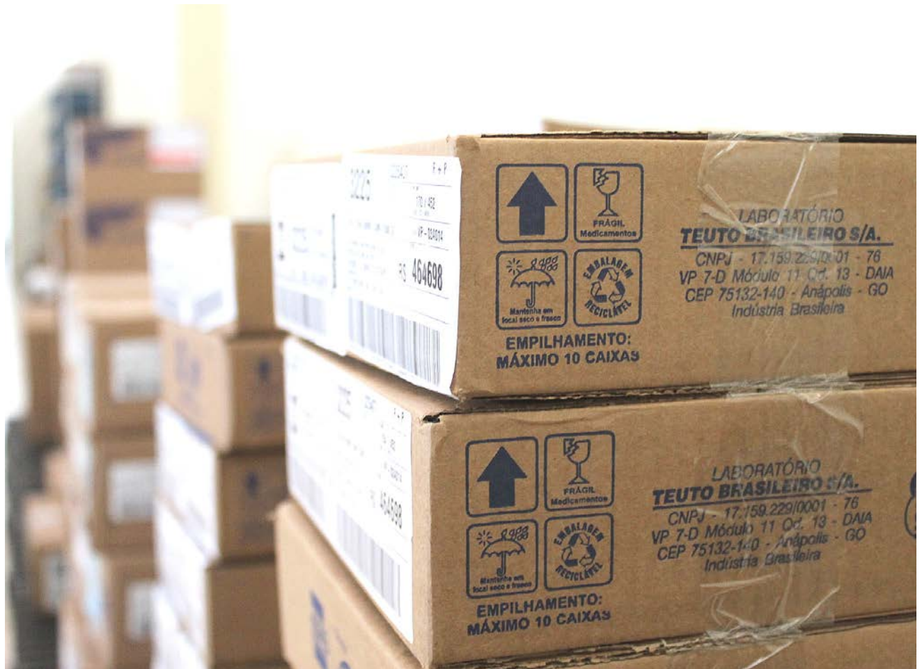
Estoque deve ser regularizado nos próximos meses