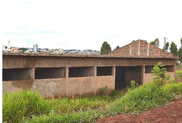
A obra estava abandonada há anos

A verba faz parte do Programa 'Saúde em Ação', uma parceria da Secretaria da Saúde com o Banco Interamericano de Desenvolvimento (BID). O programa prevê a construção de unidades básicas, todas equipadas, mobiliadas, informatizadas e com treinamento para os servidores.