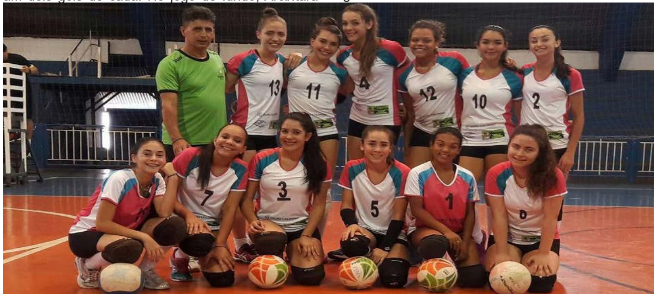
Equipe de Itararé venceu a partida contra Itapeva por 2 sets a 0.

ré vez bonito e venceu de 5 a 0 Athenas Sengés. Na segunda-feira (13) também teve partidas. Pelo grupo C São José perdeu de goleada para Futsal Itararé / Café Tetra. Foram 13 gols contra 3. Bairro Velho também não teve muita sorte e marcou só 6 contra 11 do Jardim São Paulo. O grupo D jogou na terça-feira (14). Atlético S. Clube venceu de 6 a 5 Defensores, enquanto Futsal Itararé / Premier ganhou de 9 a 3 da equipe Audax. Os próximos jogos acontecerão segunda (20) e terça-feira (21) a partir das 19h no Ginásio Lauro Loureiro de Mello. Os times disputarão uma vaga para a semifinal. Na primeira partida jogam Futsal Itararé / Café Tetra x Audax, após Futsal Itararé / Premier x Jardim São Paulo. No dia seguinte será a vez de Fazenda Primavera x Elite A e Palestra Cruzeiro x Atlético Unidos entrarem em quadra. A entrada é gratuita.