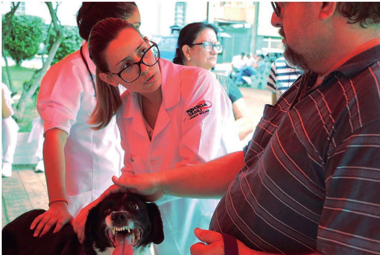
Evento reuniu 60 estudantes de medicina veterinária e realizou mais de 200 consultas. Pág 3

Pilates Solidário Data: 19 Hora: 8:30h Local: Praça Coronel Jordão (Matriz) Doe 1 quilo de alimento não perecível