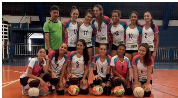
Equipe venceu a partida contra Itapeva por 2 sets a 0. Pág 3