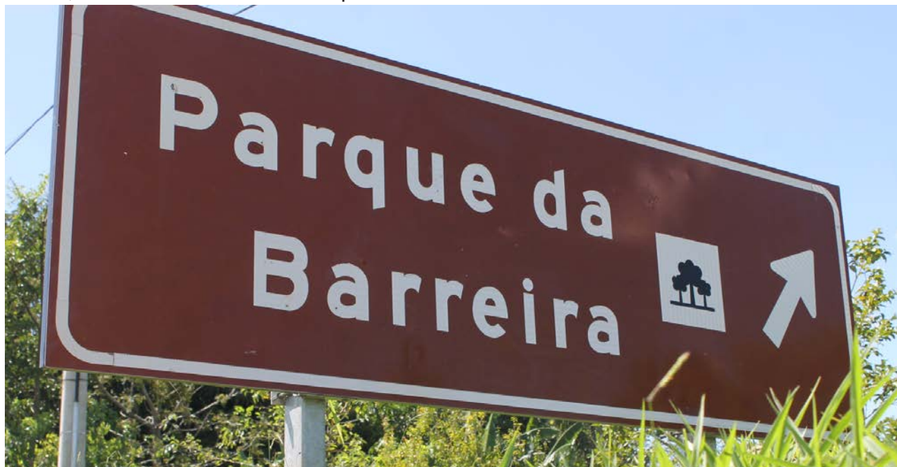
Potencial e posição geográfica do município favorecem investimento pelo Ministério do Turismo

turísticas, pois é um local muito bonito. Para a administração municipal a reunião foi produtiva e demonstrou que Itararé está no caminho certo, visto que o município está procurando com fundamentação técnica o reconhecimento pelo Estado como um promissor destino turístico.