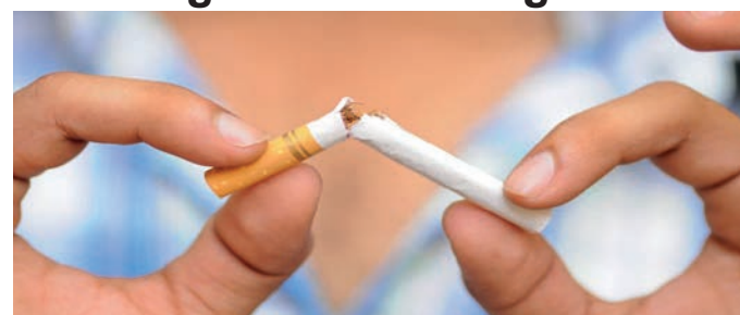
O trabalho é desenvolvido com aqueles que têm maior dificuldade para mudança de seu padrão de consumo do tabaco. Hoje são atendidas 60 pessoas, que recebem assistência de médicos e enfermeiros das unidades de saúde do município. Pág 5