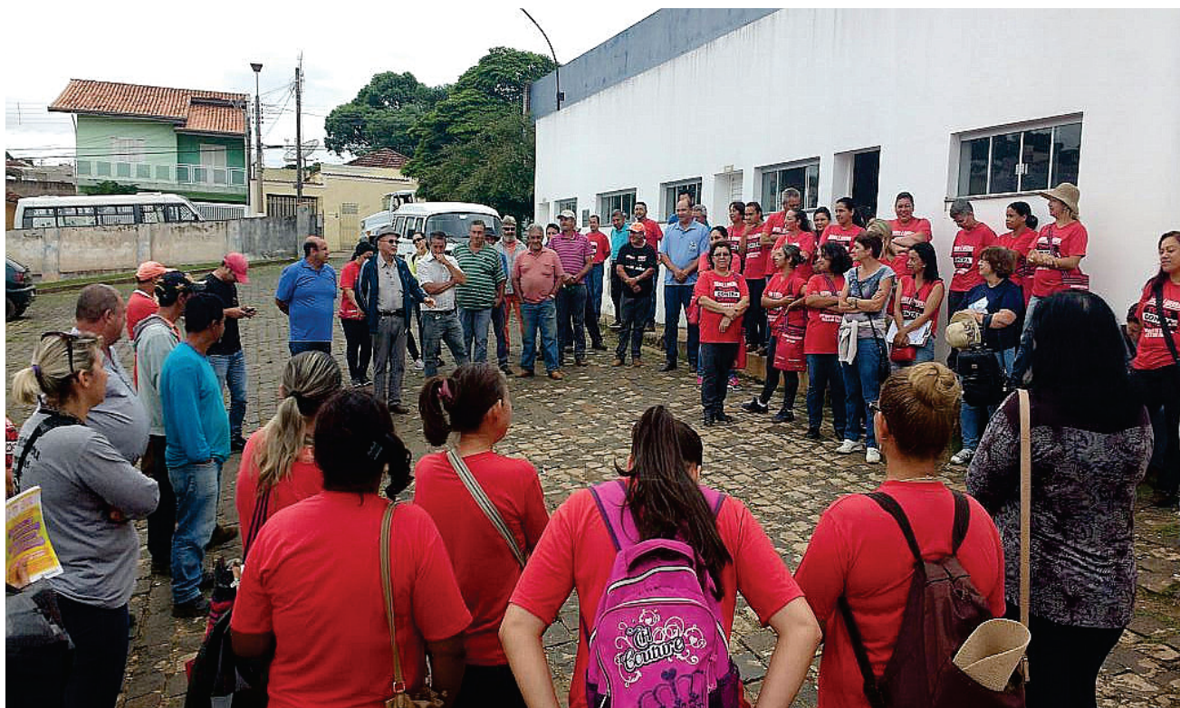
Equipe de funcionários, reunidos momentos antes de iniciar o mutirão

A Secretaria de Saúde informa que neste sábado (11) o mutirão de limpeza acontecerá novamente. Os bairros contemplados serão informados pelos agentes de saúde com um dia de antecedência.