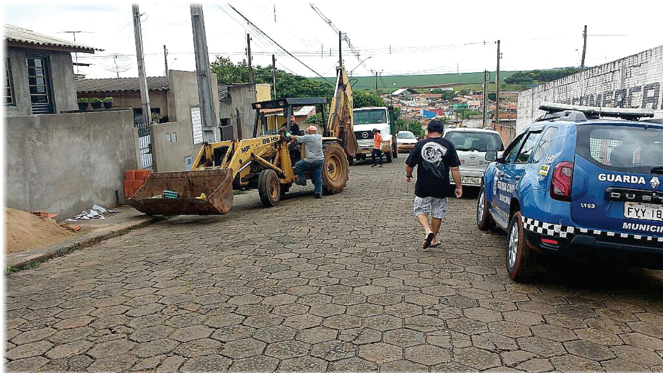
Ação reuniu 156 funcionários e retirou 69 caminhões de entulho Pá. 03