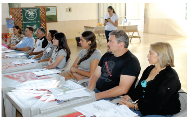
Procura por capacitação no segmento turístico é o que mais cresce. Pág.02