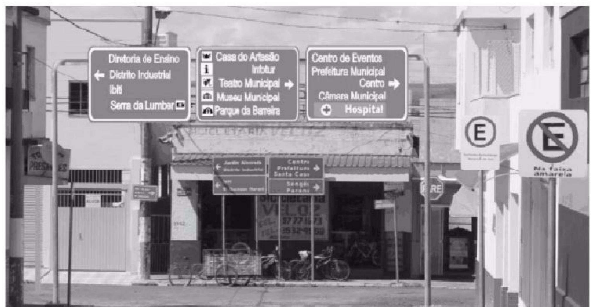
Rua Tiradentes recebeu sinalização com informações turísticas

O número de pessoas que procuram Itararé como destino de lazer e aventura tem aumentado nos últimos anos de maneira satisfatória, aquecendo o trade turístico que são os meios de hospedagem, bares, restaurantes, agências de viagens, transporte, lojas de souvenir's e todas as atividades comerciais periféricas ligadas direta ou indiretamente a atividade turística.