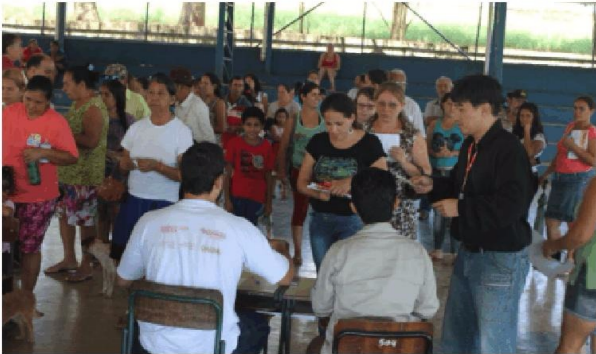
A ação aconteceu na quadra da Escola Maria Jesus Klocker Camargo, na Vila Novo Horizonte e contou com a presença das famílias contempladas e diversas autoridades. Pág.3