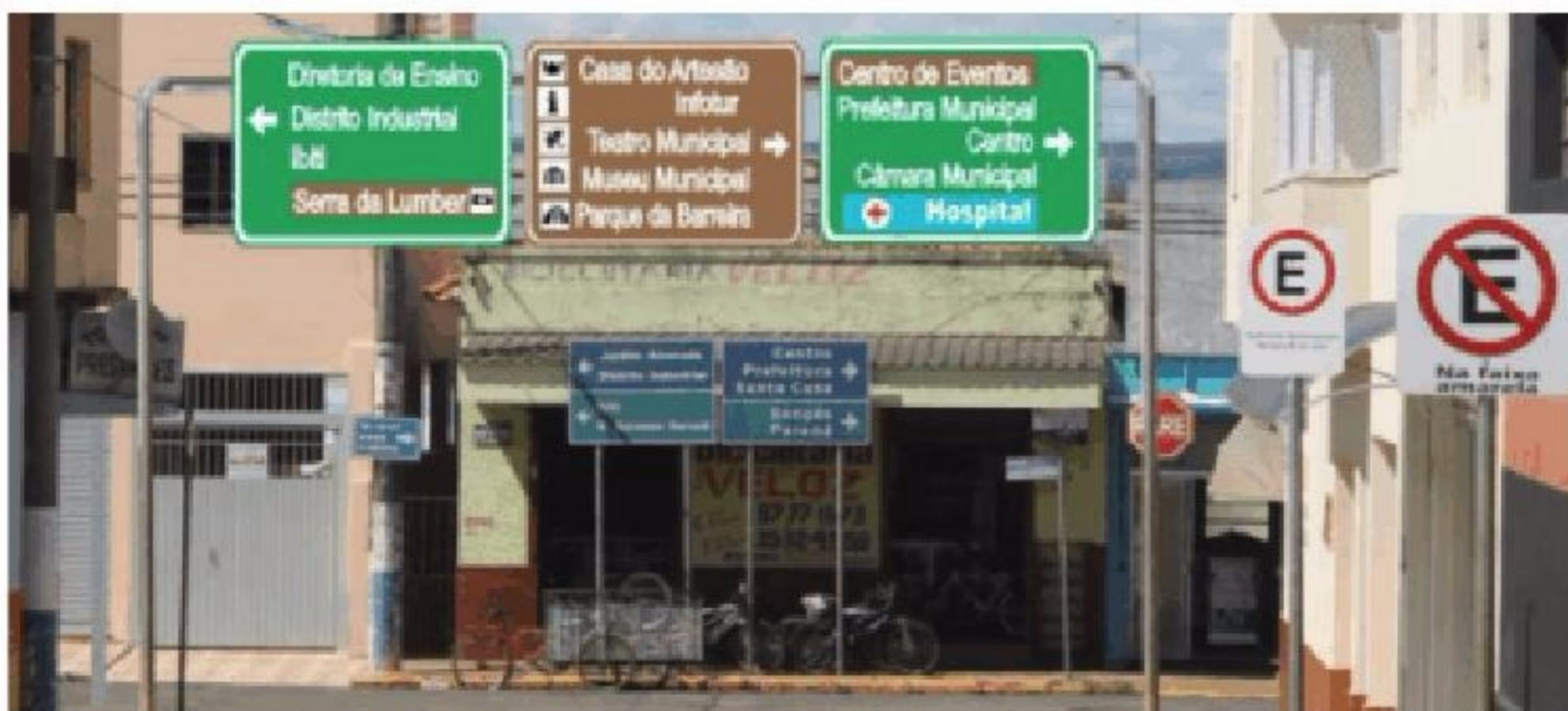
A Prefeitura Municipal de Itararé, através do Demutran iniciou a colocação de placas indicativas no município. Pág.3