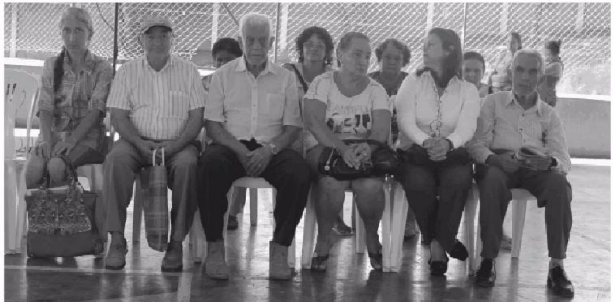
Moradores contemplados com os Títulos do ITESP

O Programa Minha Terra de regularização fundiária urbana é uma ação social do Governo de São Paulo, executada pela Fundação Itesp, com o objetivo de identificar áreas passíveis de regularização fundiária e outorgar títulos de propriedade nesses locais, conforme a legislação