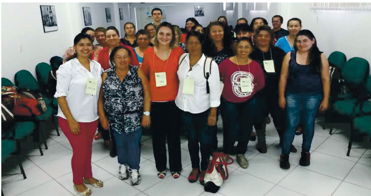
Equipe de profissionais da Saúde que participaram da capacitação: Caminhos do Cuidado

As aulas encerraram na última sexta-feira (8) e a formatura dos profissionais ocorre nesta sexta-feira, dia 15 de maio.