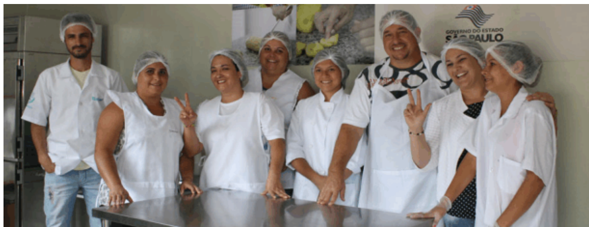
Durante o curso os alunos aprenderam técnica para dez tipos de pães

A Prefeitura de Itararé conta com uma padaria artesanal inaugurada em julho de 2013. As aulas do curso de panificação aconteceram no local, onde também são produzidos diariamente 11 mil pães, destinados às entidades locais e toda a rede estadual e municipal de ensino. A padaria municipal fica na rua XV de Novembro, 938, no Centro.