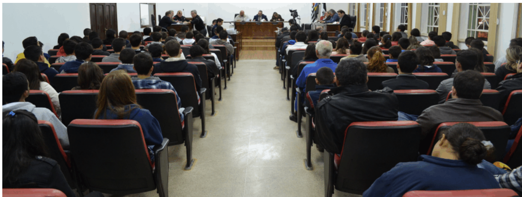
Sessão da Câmara

(Adaptação de matéria publicada em 16/05/2013)