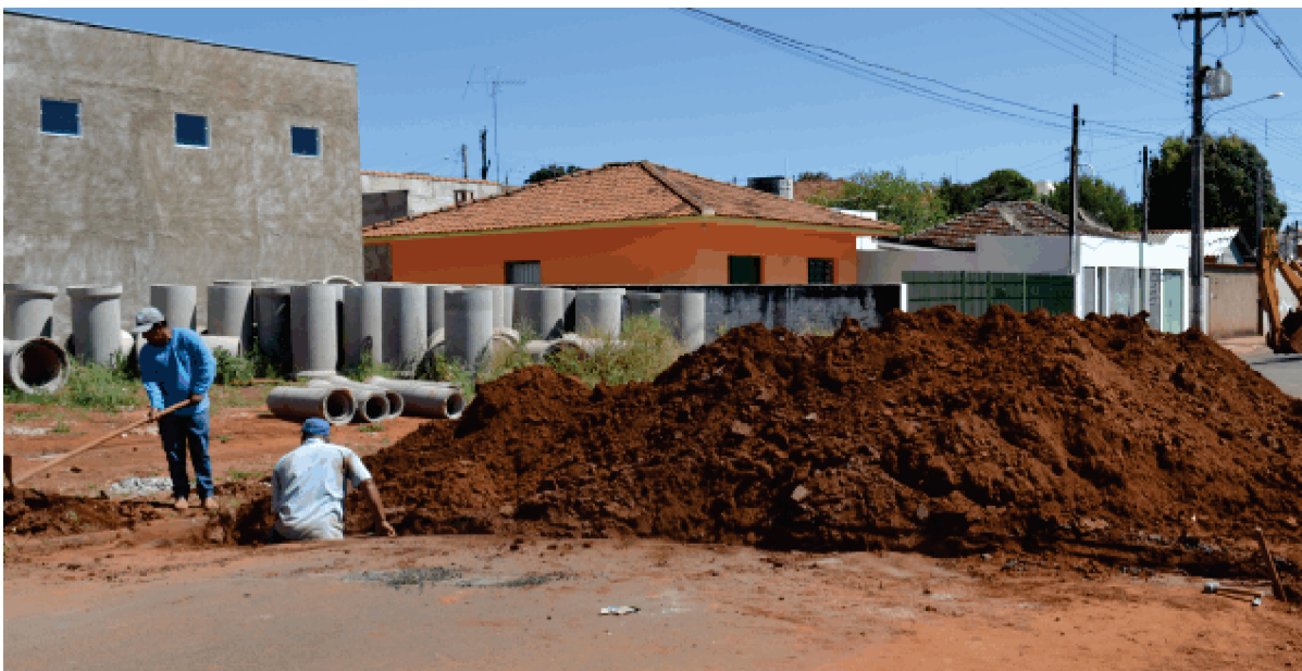
Obra em rua do município

também responsável por eventuais reparos e substituição de meios-fios, guias e sarjetas que sejam danificadas durante a obra.