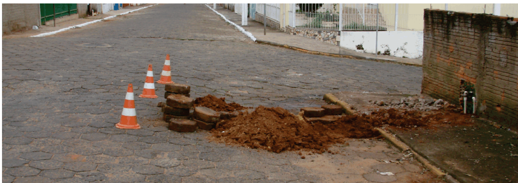
Obra em rua do município

A lei 3411 aguarda regulamentação do Executivo.